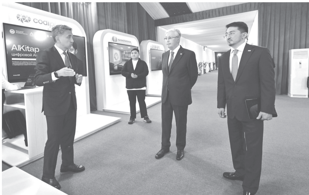
Жалғасы. Басы 1-ші бетте.

Суперкомпьютердің есептеу қуатын нейрожелі шешімдерін әзірлеумен айналысатын стартаптар, университеттер мен ғылыми орталықтар, сондай-ақ мемлекеттік мекемелер мен жеке компаниялар пайдалана алады.