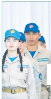
ӘСКЕРИ-ПАТРИОТТЫҚ ЖАСТАР ЖИЫНЫ ӨТТІ. АТАЛҒАН ЖЫННА АРНАЙЫМ КЕЛГЕН ПРЕЗИДЕНТ - ҚАЗАҚСТАН ҚАРУЛЫ КҮШТЕРІНІҢ ЖОҒАРҒЫ БАС ҚОЛБАСШЫСЫ ҚАСЫМ-ЖОМАРТ ТОҚАЕВ «АҰБЫН» ӘСКЕРИ-ПАТРИОТТЫҚ ЖАСТАР ЖИЫНЫНЫҢ АШЫЛУ РӘСІМІНЕ ҚАТЫСЫП, ЖИЫНДЫ АШЫП БЕРДІ.

АҚТӨБЕ ОБЛЫСЫНДА «АҰБЫН-2025» ХІ ХАЛЫҚАРАЛЫҚ