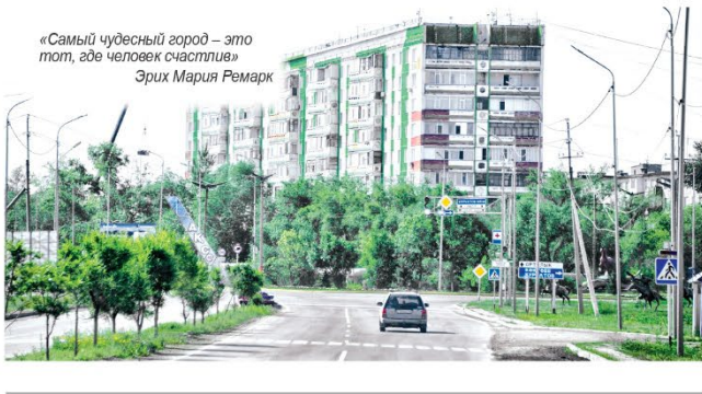
«Самый чудесный город – это тот, где человек счастлив» Эрих Мария Ремарк