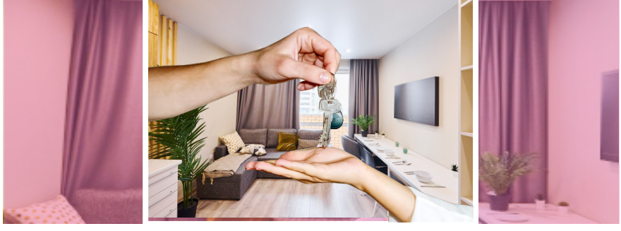
Қонаев қаласына облыс орталығы мәртебесі берілгелі мұндағы тұрғын үйді жалға алу ақысы үздіксіз өсіп келеді. Көші-қонның белең алуымен тұрғын үй жалдауға деген сұраныс барған сайын арта түскен.