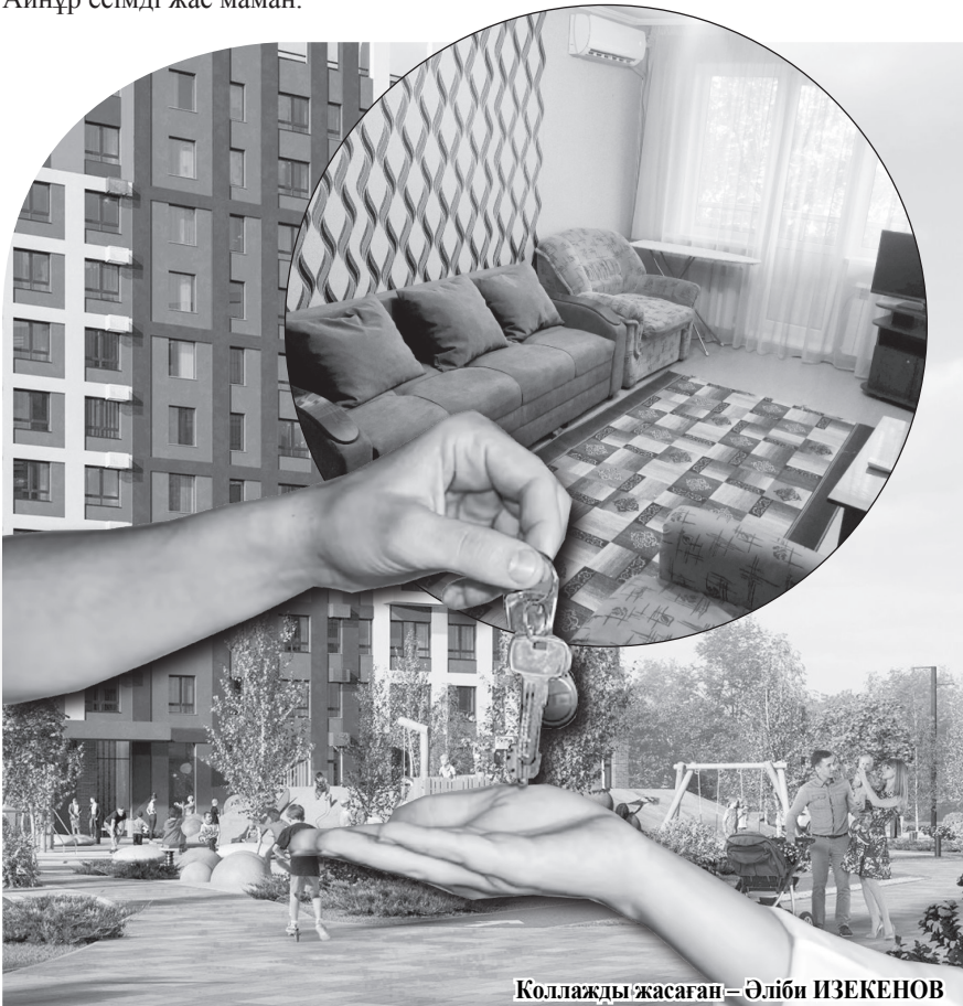
Коллажды жасаған – Әліби ИЗЕКЕНОВ