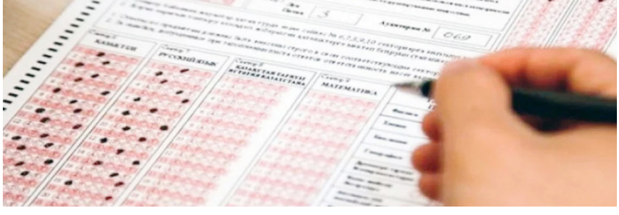
ҰБТ-ның өзі талапкер білімін анықтауға толық мүмкіндік бере ме? Тест форматы терең ойлауға емес, еске сақтап, тез жауап беруге бейімделген. Бұл шығармашылық қабілеті бар, бірақ тест форматында өзін көрсете алмайтын жастар үшін әділетсіздік емес пе?