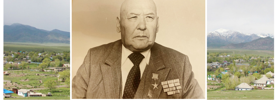
Әшімбаевтың өмірлік ұстанымы елге адал қызмет ету, халыққа жағдай жасау еді. Ол ешқашан Үкімет қаржысына сүйенген жоқ, халықтың қолдауына арқа сүйеп, өзінің өмір тәжірибесімен басшылық етті.