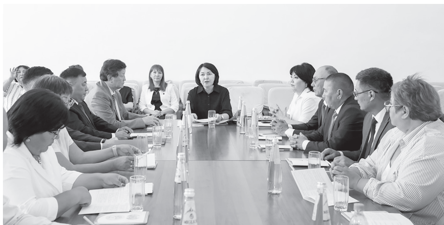
Облыстық білім басқармасы педагогтердің кәсіби өсуіне қолдау көрсету, тиімді тәжірибелер алмасу және жаңа оқу жылының басым бағыттарын айқындау мақсатында Қарасай ауданындағы Қаскелең, Қошмамбет мектептері мен Шамалған ауылындағы көпсалалы колледжде «Білім келешегі: адал азамат – кәсіби маман» тақырыбында панельдік сессия отырысын өткізді.