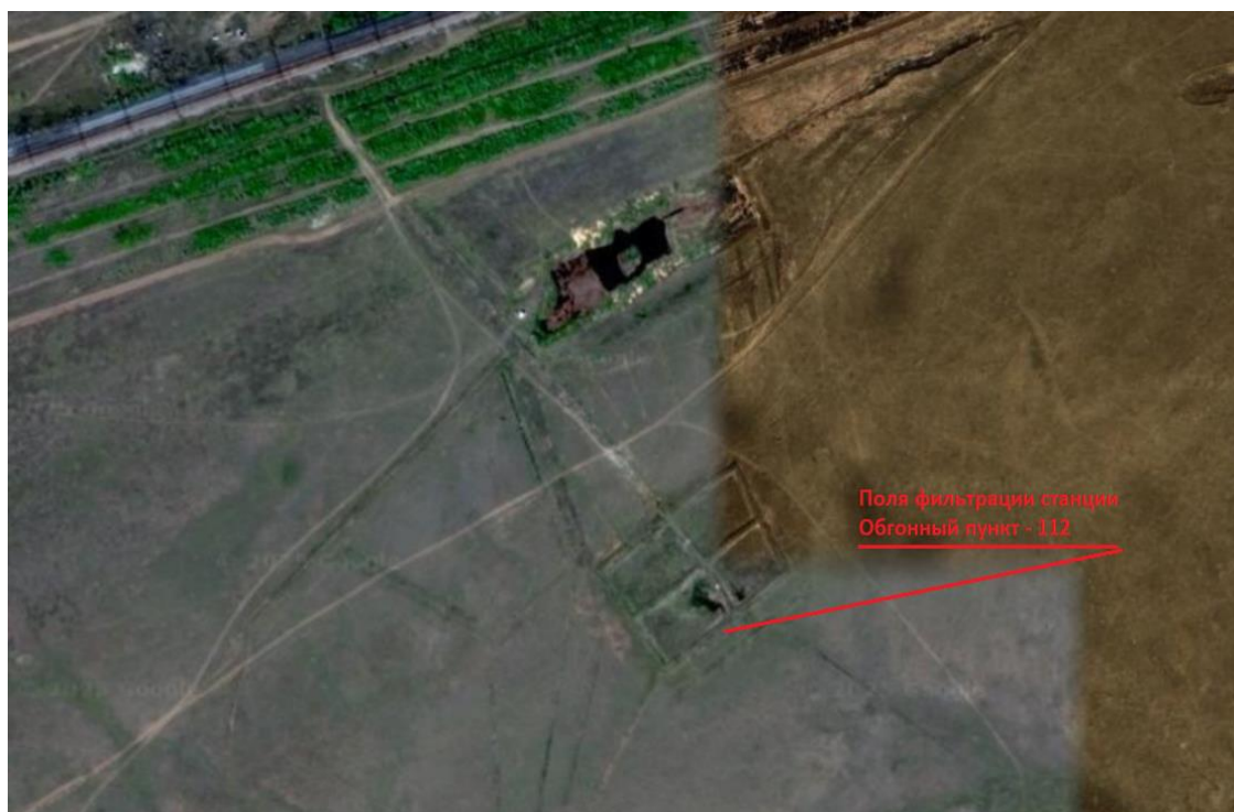
1-сурет – Обгонный Пункт станциясының картасы – 112

«Теміржолсу-Павлодар» ЖШС қызметінің негізгі бағыты – халықты және теміржол вокзалдарында және трассаларда орналасқан ұйымдарды сумен және жылумен қамтамасыз ету, сондай-ақ келісім-шарт негізінде тұрмыстық сарқынды суларды жинау қызметтерін көрсету. Кәсіпорынның балансында келесі нысандардың ағынды суларды сүзу алаңдары бар: Обгонный Пункт станциясы - 112. Обгонный Пункт 112 Павлодар - Астана темір жол желісінде, Екібастұз станциясынан 78 км қашықтықта орналасқан. Сүзгі егістіктері 28.10.2004 жылғы № 0107114 уақытша өтеулі жер пайдалану (жалдау) құқығына актісі бойынша Төрт-Құдық ауылдық округінің аумағында 1,2722 га жер учаскесінде орналасқан.