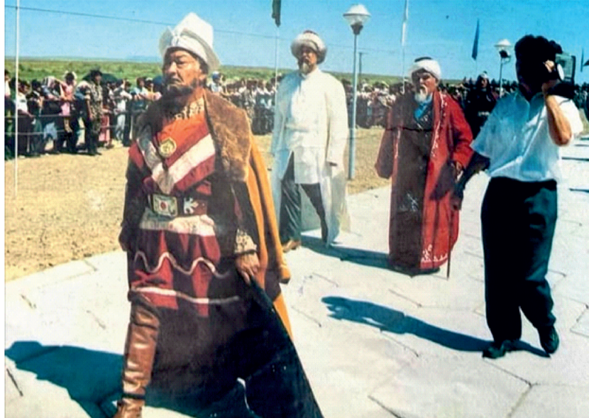
тын қорында сақталған.

1989 жылы шыққан Қазақ ССР энциклопедиясының 4-томына (107-бет) Ақсуат халық аспаптар оркестрінің әншісі, сирек талант иесі ретінде есімі енген. 2006 жылы «Қазақстан Республикасының мәдениет қайраткері» атағын алды. Найманғазының орындауындағы бірнеше әндер, Ә.Бейсейітовтің «Алматы жүрегімде», А.Еспаевтың «Ақын толғауы», Естайдың ариялары секілді құнды шығармалар Қазақ радиосының ал-