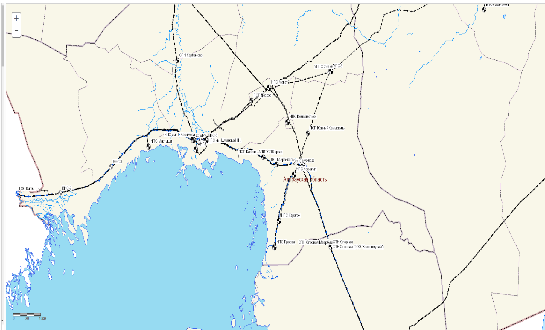
Рис.1 Ситуационная схема района расположения НПС «Прорва»