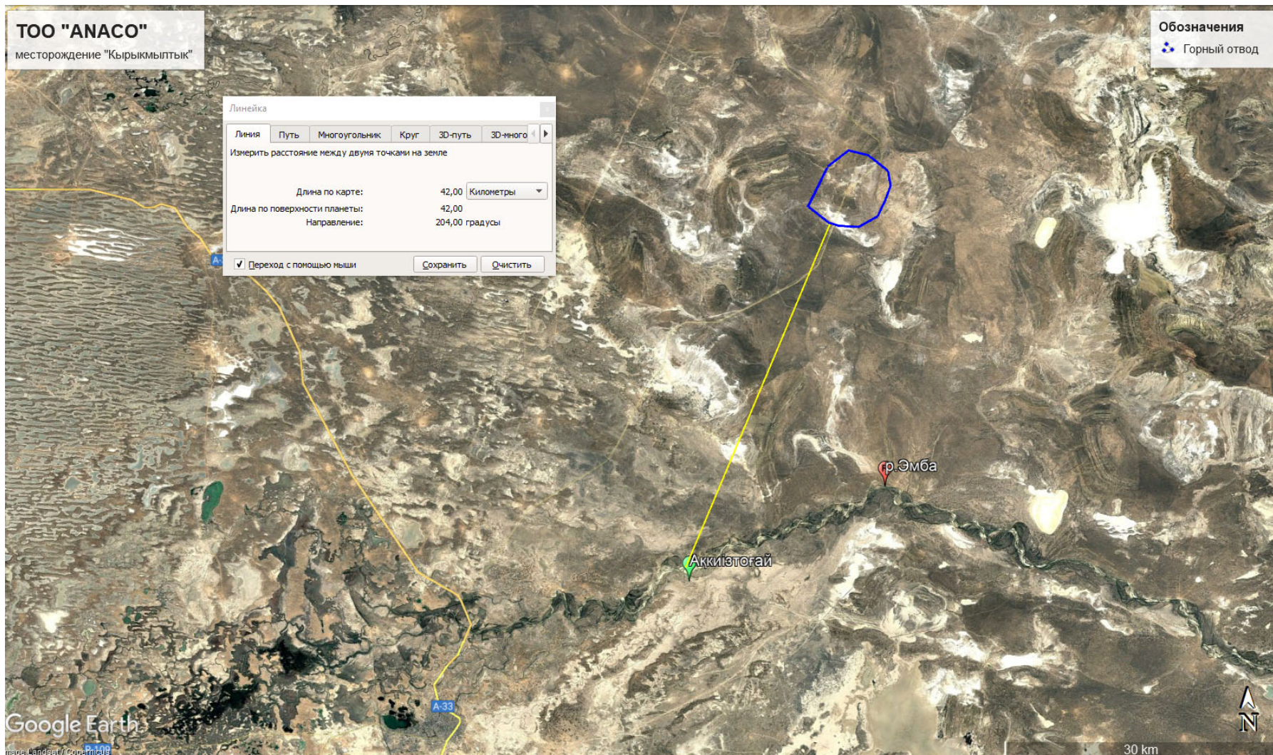
Рис. 2 - Обзорная карта района работ с указанием расстояния до ближайшей ЖЗ