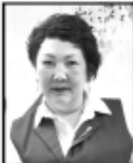
№ 17 ЖОБЕМ ұжымы

Толығырағы туралы, жағдайы жөніндегі біліміз.