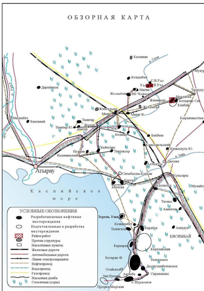
Рис. 1 - Обзорная карта района работ