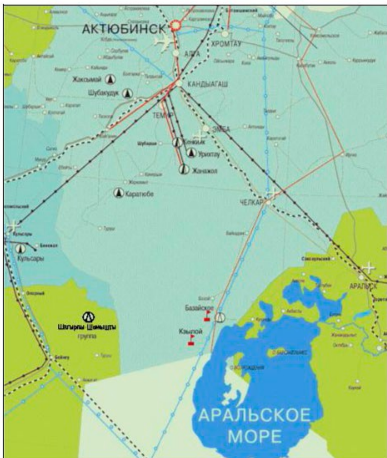
Рис. 1. Обзорная карта расположения месторождения