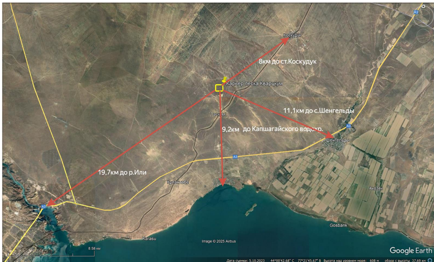
Рис.2 Обзорная карта расположения участка

2) описание затрагиваемой территории с указанием численности ее населения, участков, на которых могут быть обнаружены выбросы, сбросы и иные негативные воздействия намечаемой деятельности на окружающую среду, с учетом их характеристик и способности переноса в окружающую среду; участков извлечения природных ресурсов и захоронения отходов;