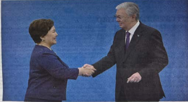
ҰСТАЗДАР КҮНІ ҚАРСАҢЫНДА АТЫРАУ