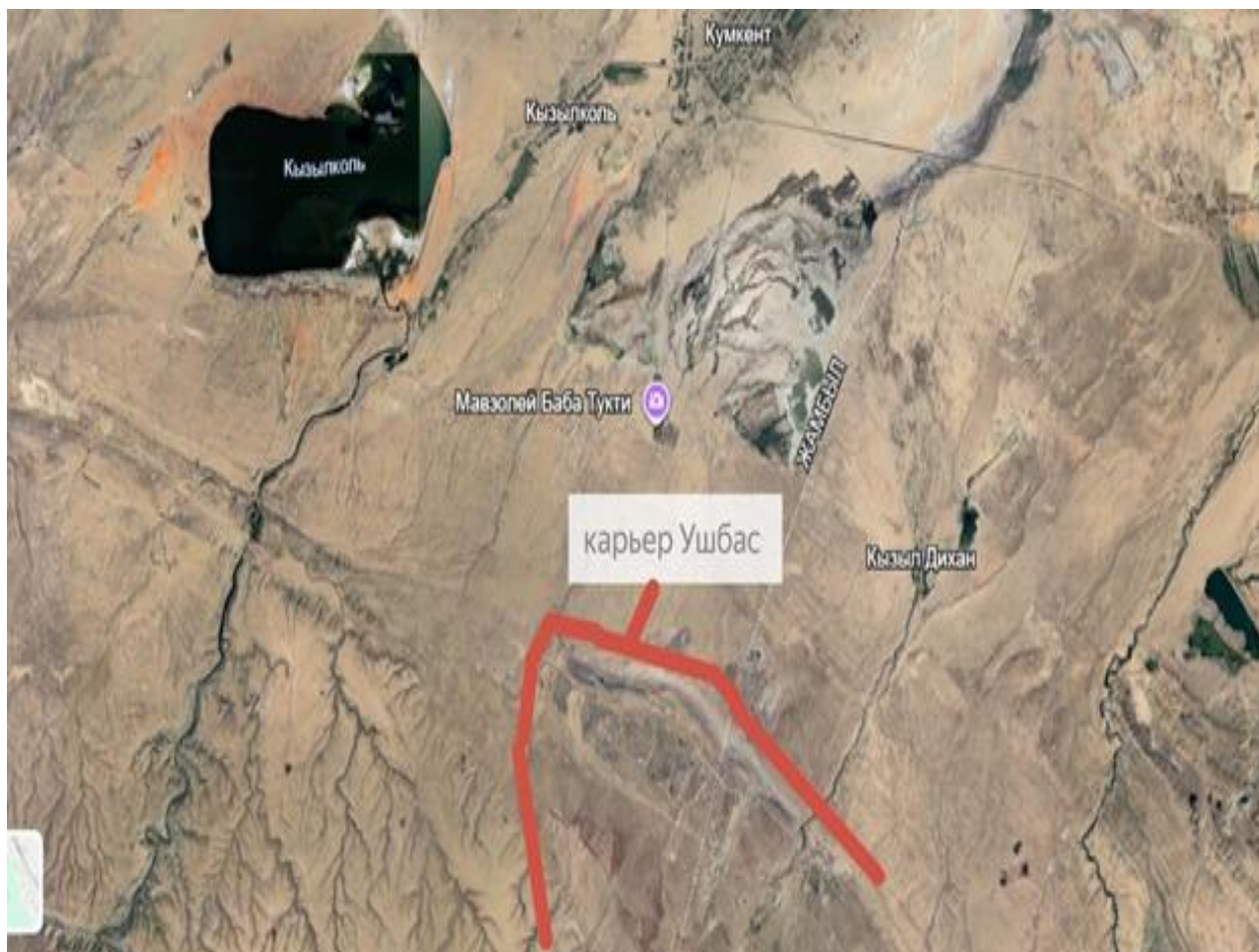
Рисунок 0.1 – Ситуационная карта-схема района расположения объекта.

На отведенном участке не имеются зеленые насаждения.