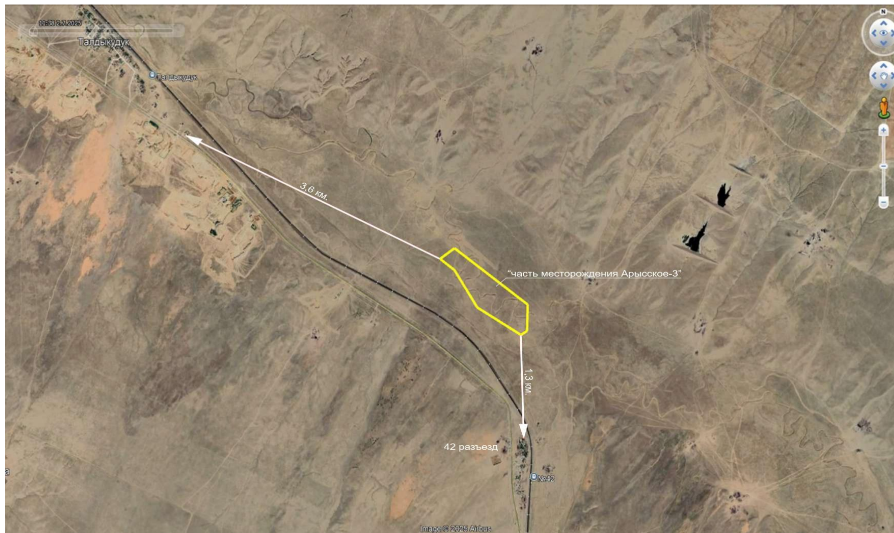
Рис. 1.2. Ситуационная схема.

Ближайшим населенным пунктом являются село Талдыкудук (3,6 км), расстояние до 42 разъезда – 1,3 км..