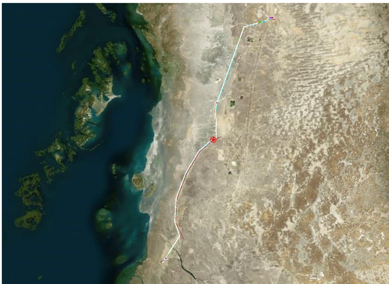
Рис. 1 Обзорная карта

Растительный и животный мир беден, что характерно для пустынь и полупустынь. Распространены пресмыкающиеся и членистоногие.