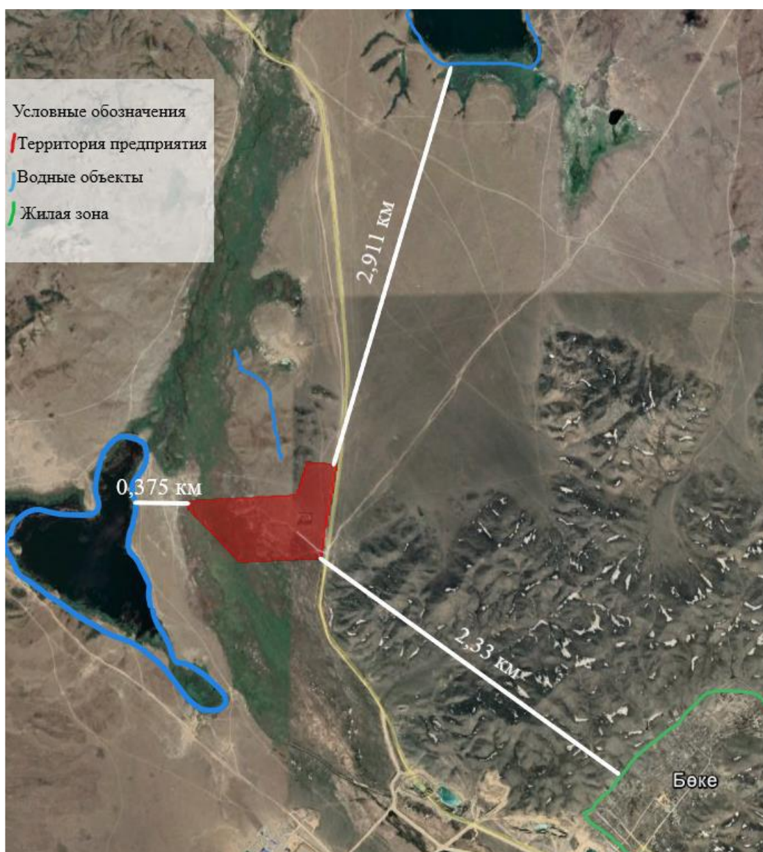
Рис. 2. Ситуационная карта расположения участка Токум относительно с. Боке (Юбилейный) (2,33 км) и ближайших водных объектов