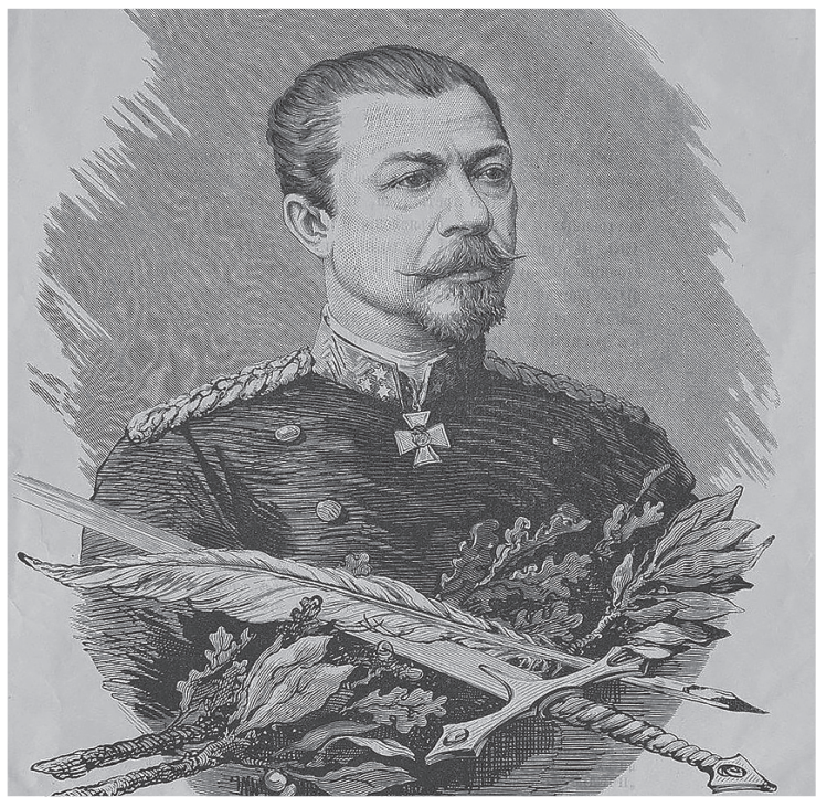
Михаил Григорьевич Черняев (22 октября (3) ноября 1828 года — 4 (16) августа 1898 года) — русский военный и политический деятель, генерал-лейтенант, туркестанский генерал-губернатор, главнокомандующий сербской армией (моравским корпусом сербской армии).

Александр Иванович Щербинин, член Русского географического и Российского военно-исторического обществ, историк г. Москва, 2025 г.