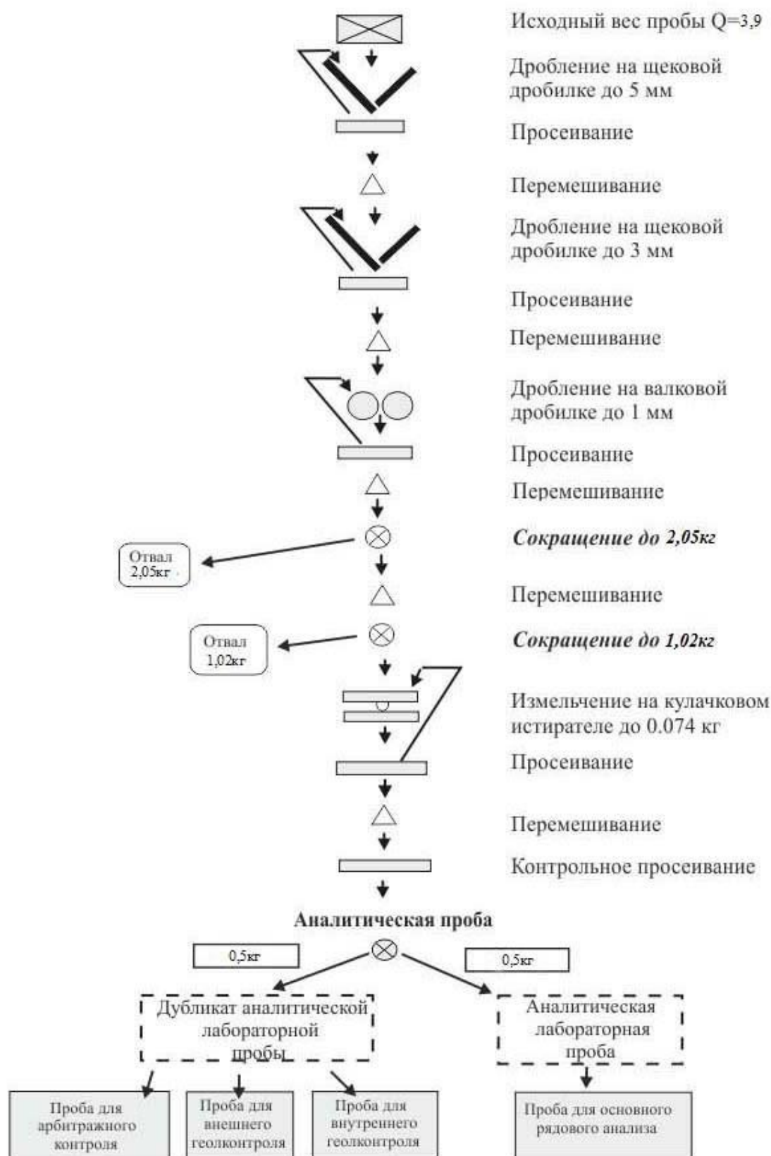
Рис. 4.1 Схема обработки бороздовых и керновых проб