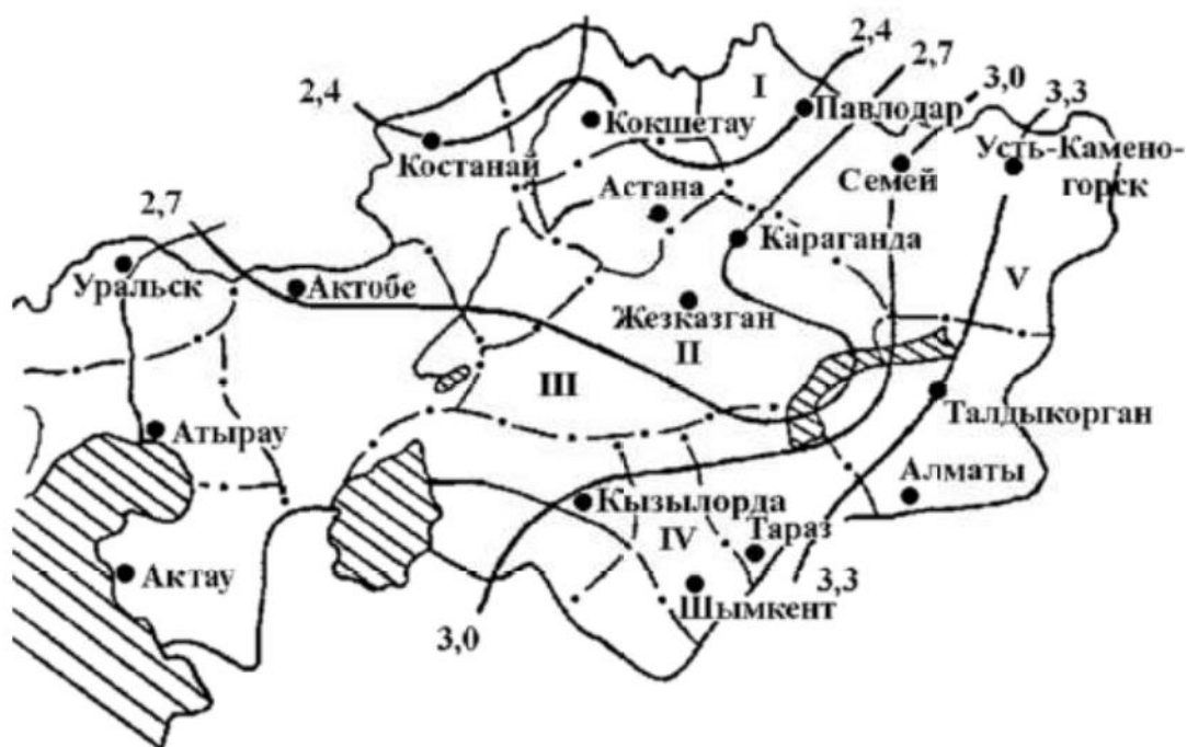
Рисунок 1.1 – Распределение значений потенциала загрязнения атмосферы для территории Республики Казахстан

Район размещения участка находится в зоне с высоким потенциалом загрязнения атмосферы (ПЗА), т.е. климатические условия для рассеивания вредных веществ в атмосфере являются вполне благоприятными.