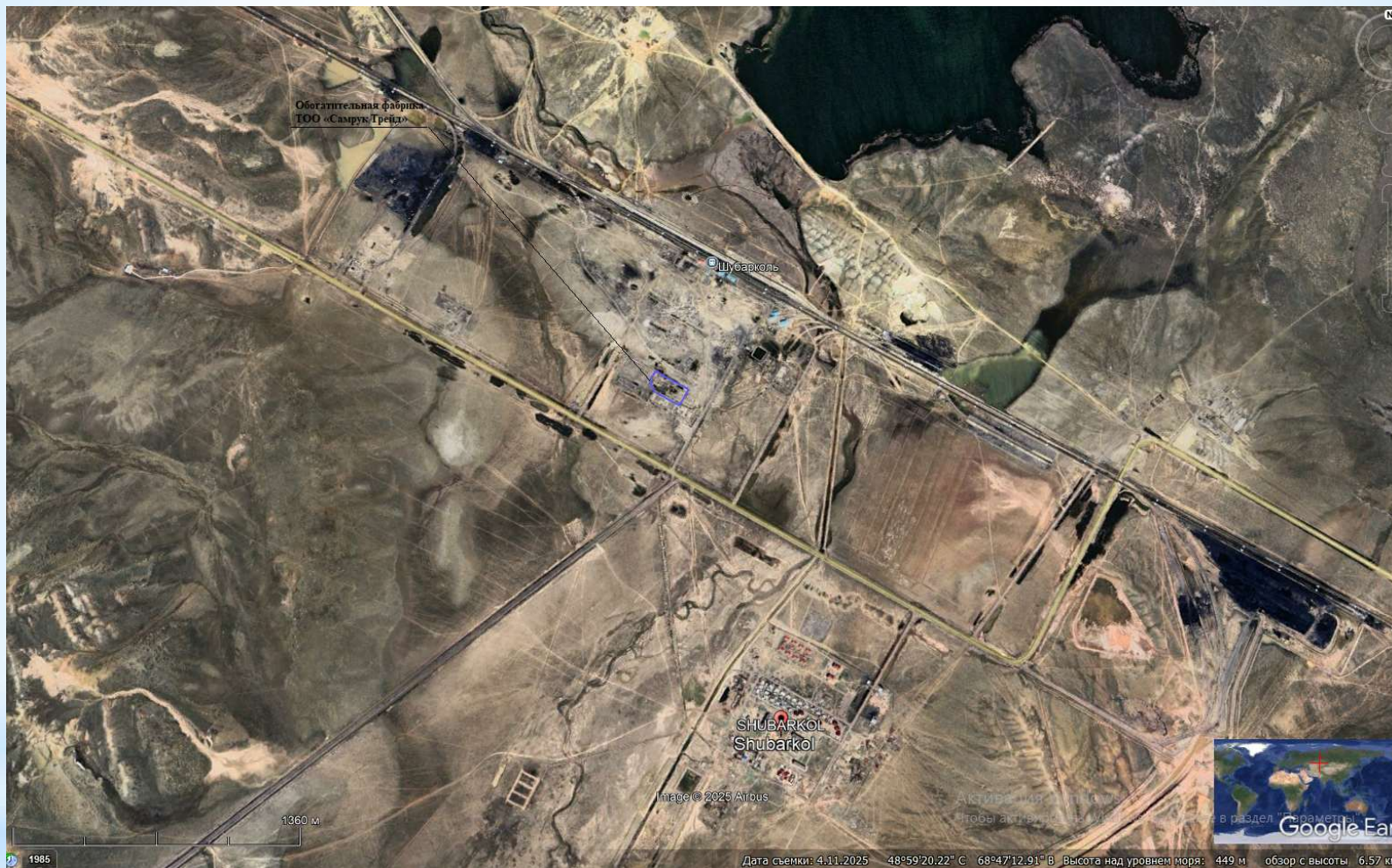
"Самұрық Трейд" ЖШС көмірді байыту кәсіпорнының орналасу картасы Карта расположения Предприятия по обогащению угля ТОО «Самрук Трейд»