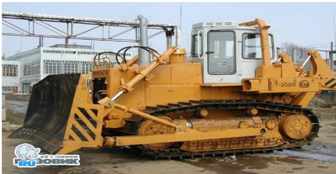
Рис. 4.2 бульдозера-рыхлителя Четра Т-130