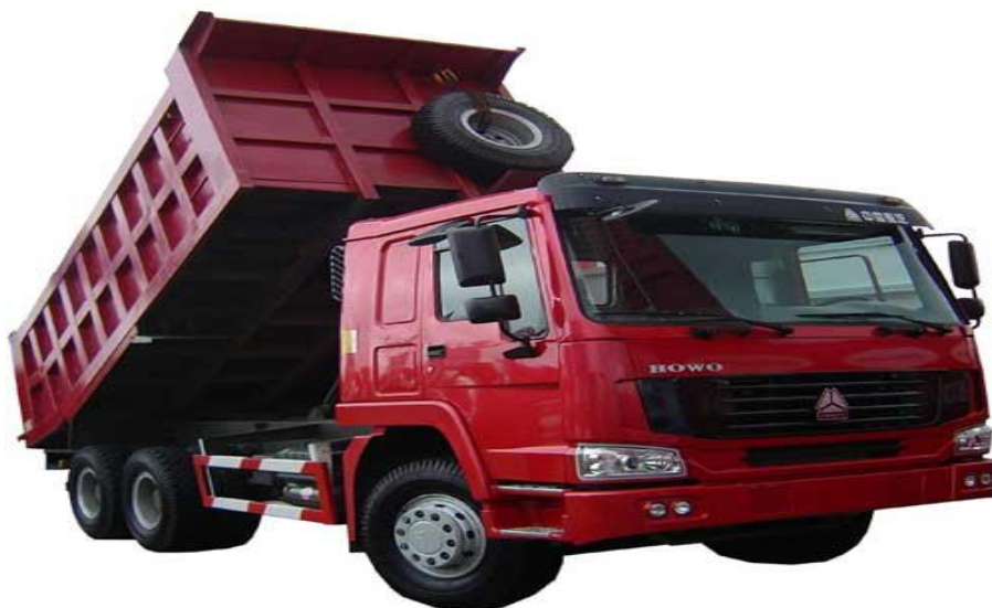
Рис. 4.3 Автосамосвал HOWO ZZ3327

Автосамосвал HOWO ZZ3327 имеет габариты 7356х2496х3386мм, размер кузова – 4800х2300х1400мм, массу без нагрузки 12460кг, грузоподъемность 25т. Максимальная скорость движения самосвала – 75км/час, максимальный радиус поворота – 18,3м, угол подъема – 16°, угол спуска – 26°. Расход топлива составляет 32л на 100км.