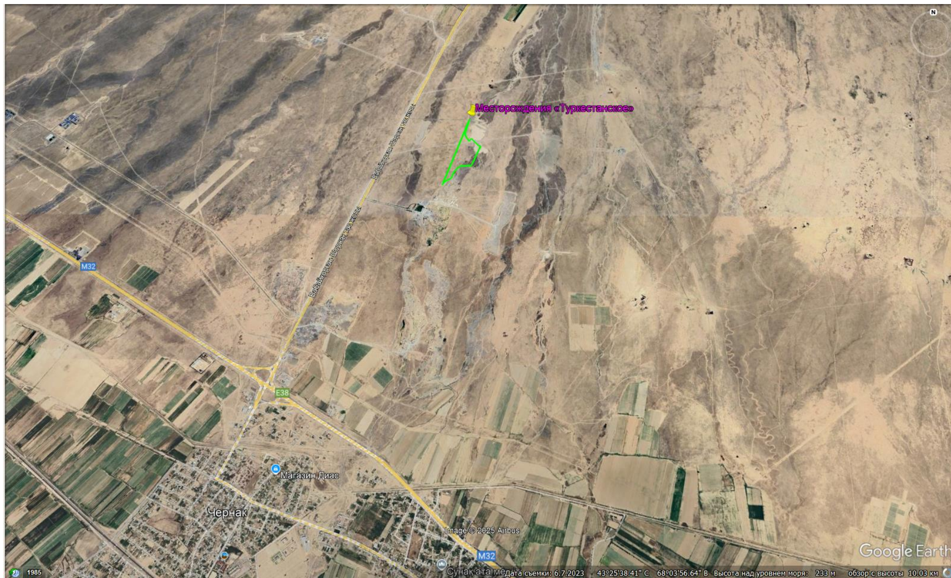
Рисунок 1.2. Карта-схема территории объекта