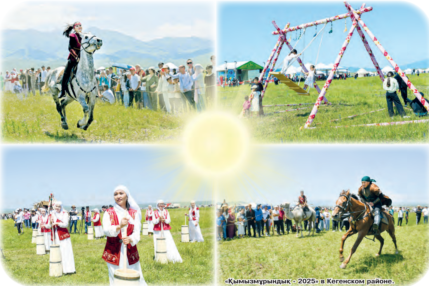
«Қымызмұрындық» - 2025» в Кегенском районе.