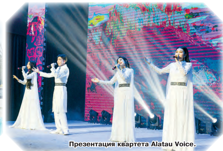
Презентация квартета Alatau Voice.

национальной одежды»), «Жаңару күні» («День обновления»), «Ұлттық спорт күні» («День национальных видов спорта»), «Ынтымақ күні» («День единства»), «Жыл басы» («Новый год»), «Тазару күні» («День очищения»).