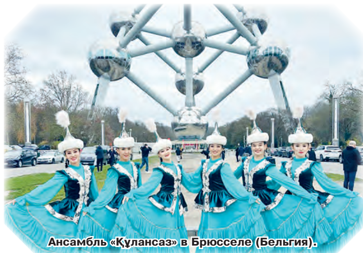
Ансамбль «Құлансаз» в Брюсселе (Бельгия).