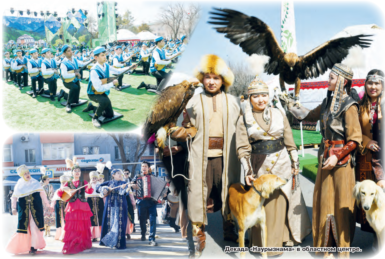
Декада «Наурызнама» в областном центре.

Итоги культурного года показывают: Алматинская область уверенно движется вперед, сохраняя уважение к прошлому и оставаясь открытой к новому. Здесь культура не замыкается в стенах учреждений – она живет в людях, передается от сердца к сердцу и продолжает писать новую историю.