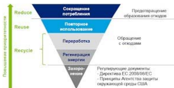
Рис. 3.1 – Иерархия с обращениями отходами.

При применении принципа иерархии должны быть приняты во внимание принцип предосторожности и принцип устойчивого развития, технические возможности и