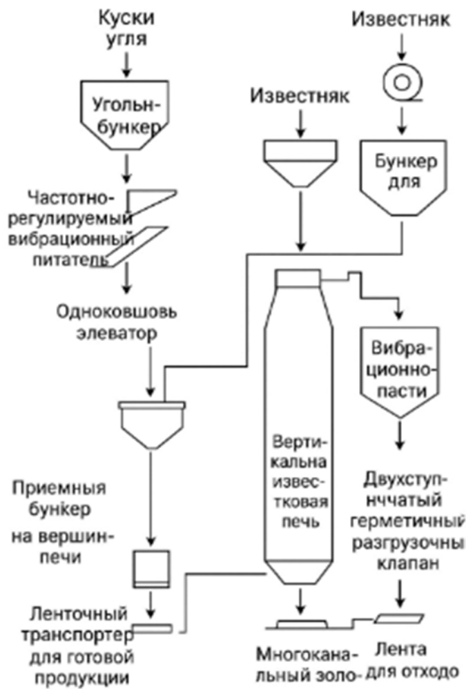
Схема технологического процесса

Процесс включает последовательные стадии: подача сырья, загрузка топлива, распределение воздуха, обжиг, выгрузка готового продукта и удаление золы.