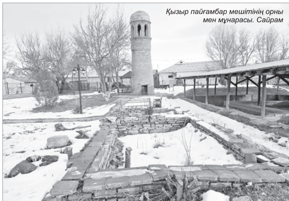
Қызыр пайғамбар мешітінің орны мен мұнарасы. Сайрам

Енді, осы тұста аздап тарихи хронологияларға зер салып, іштей сараптап көрейікші. Мұса (Моисей, Moyses) пайғамбар Исраил ұрпақтарының ежелгі патшасы ретінде тарихи тұлға деп қарастырылады. Базбір зерттеушілер б.з.д. XIV-XIII ғғ. өмір сүрген деседі. Егер, Қыдыр мен Мұса кезіксе, демек, Қыдыр пайғамбар дегеніміз одан бұрын өмір сүрген болмай ма? Бұны бір дейік. Қызыр мен Ескендір замандас болды деген әпсана-