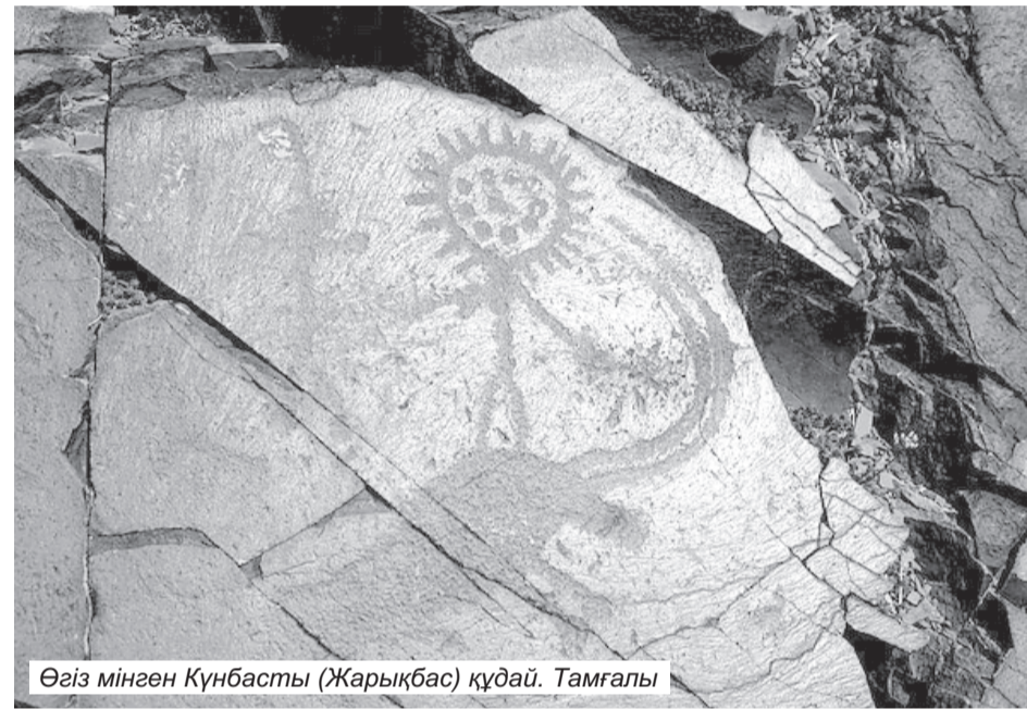
Өгіз мінген Күнбасты (Жарықбас) құдай. Тамгалы