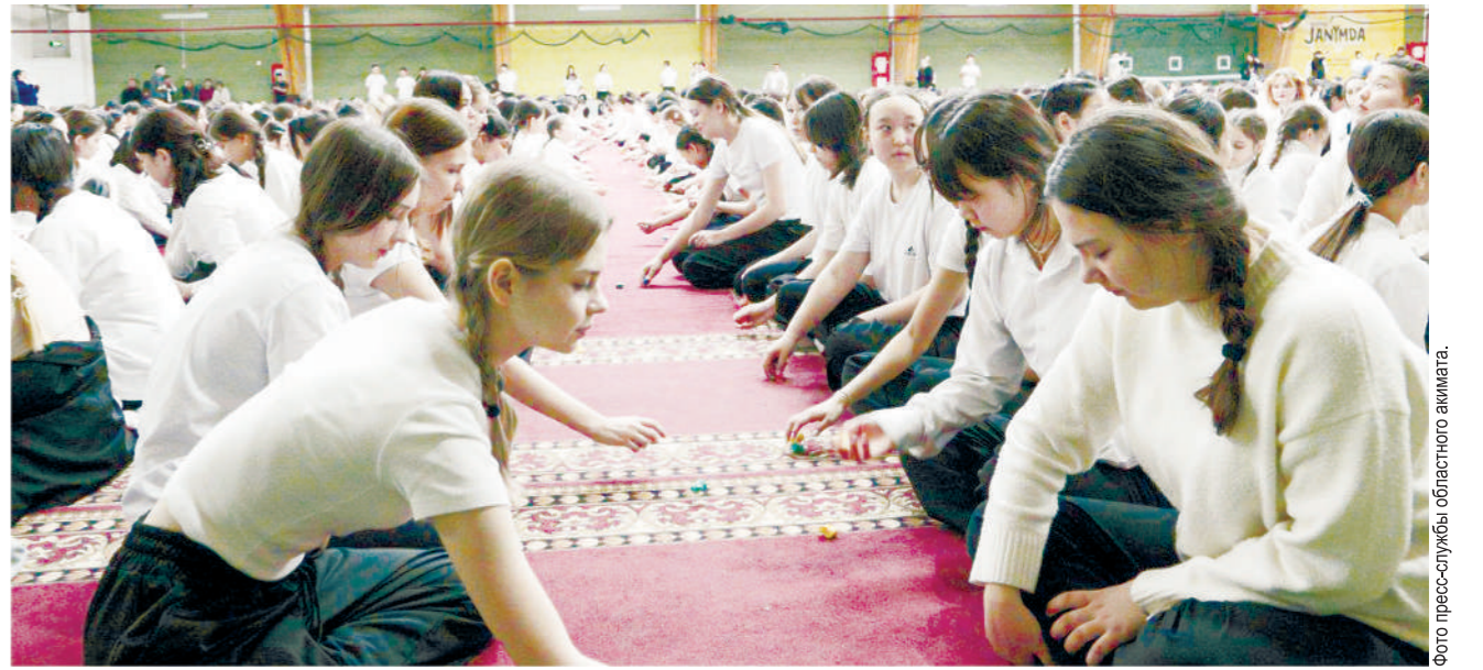
фото пресс-службы областного акмата.