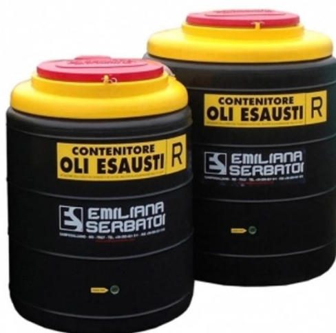
Емкость для хранения отработанного масла