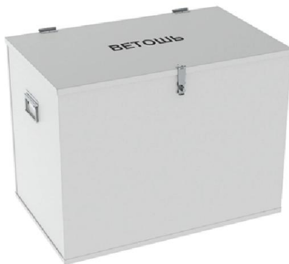
Контейнер для ветоши