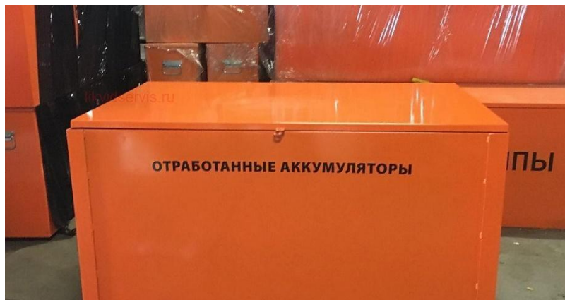
Контейнер для хранения отработанных аккумуляторов

Транспортировка отходов осуществляется в специально оборудованном транспорте, исключающем возможность потерь по пути следования и загрязнения окружающей среды, а также обеспечивающем удобства при перегрузке. Количество контейнеров – 1 шт., объем – 75 л.