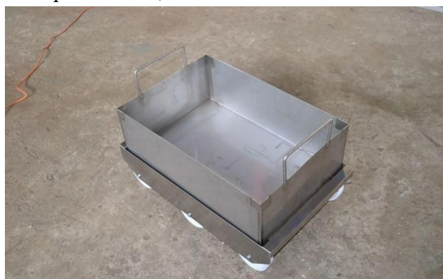
Контейнер для сварочных электродов

Количество контейнеров – 1 шт., объем – 10 л.