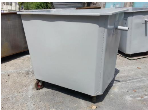
Контейнер для ТБО