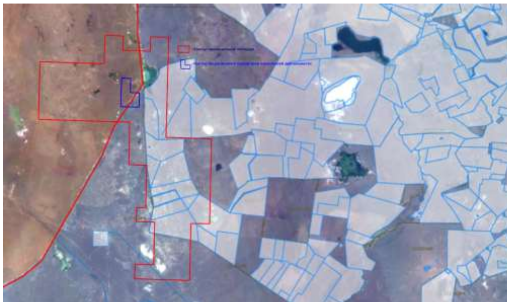
Рис.2. Схема размещения участков в пределах лицензионной площадки

На схеме красным цветом отмечена территория проведения работ по проекту «План разведки золотосодержащих руд на участке Болдыколь в Абайской и Павлодарской областях. Лицензия № 1573-EL от 20.01.2022 г.», на которую ТОО «РЛС Плюс» получено экологическое разрешение на воздействие №: KZ47VCZ06124998 от 27.03.2025 г.; синим цветом указана территории намечаемой деятельности по настоящему проекту «ПЛАН РАЗВЕДКИ на твердых полезных ископаемых на участке Болдыколь в области Абай и Павлодарской области. Блоки: М-44-62-(10б-5б-6), М-44-62-(10б-5б-11), М-44-62-(10б-5б-12).(Лицензия № 3164-EL от 17.02.2025 г).