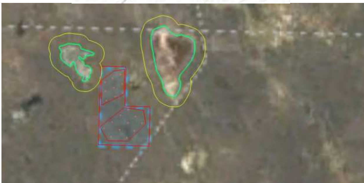
Рис.3. Водные объекты на лицензионной территории с указанными ВЗ и ВП