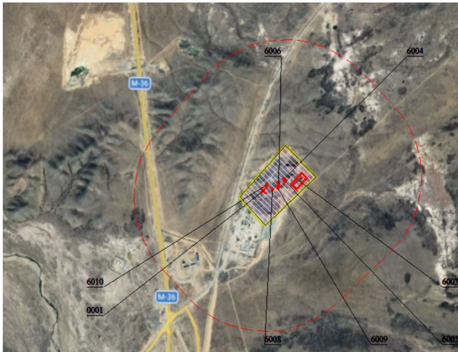
Рисунок 2.3 – Карта-схема промплощадки с указанием границ области воздействия, источников выбросов ЗВ