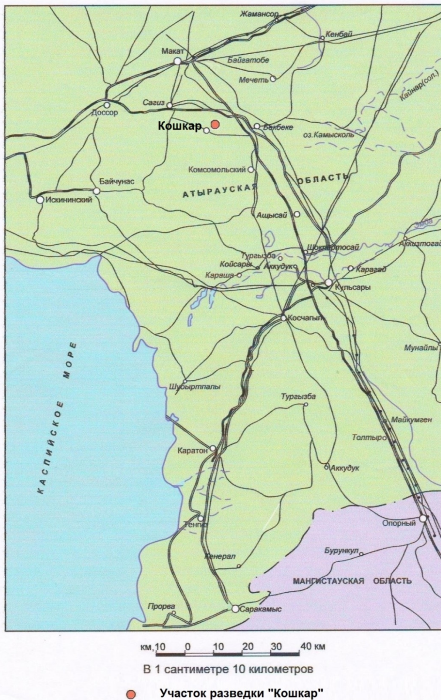
Рис.1.Обзорная карта района работ. Масштаб 1:1000000