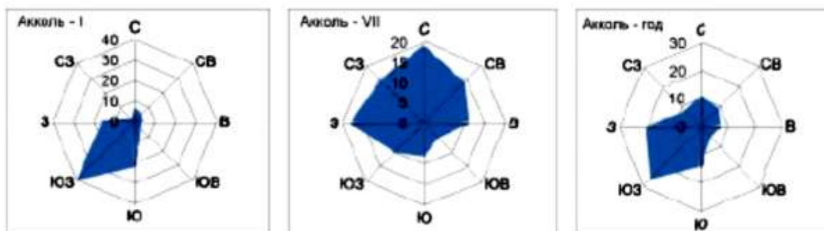
Рисунок 1.4– Роза ветров на МС Акколь