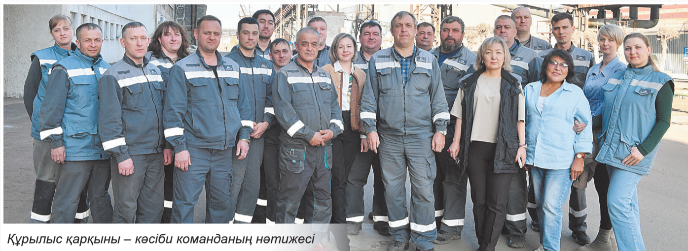
Құрылыс қарқыны – кәсіби команданың нәтижесі

5 сәуір күні «Qarmet» АҚ-ның күрделі құрылыс бөлімі өз мерейтойын атап өтеді. Бұл – комбинаттың өткенін де, бүгінін де онсыз елестету мүмкін емес бөлімше. Дәл осы бөлімнен құрылыс бастау алған және бүгінгі күнге дейін әрбір жаңа нысанды алғашқы қазық қазудан бастап пайдалануға берілгенге дейін сүйемелдеп келеді.