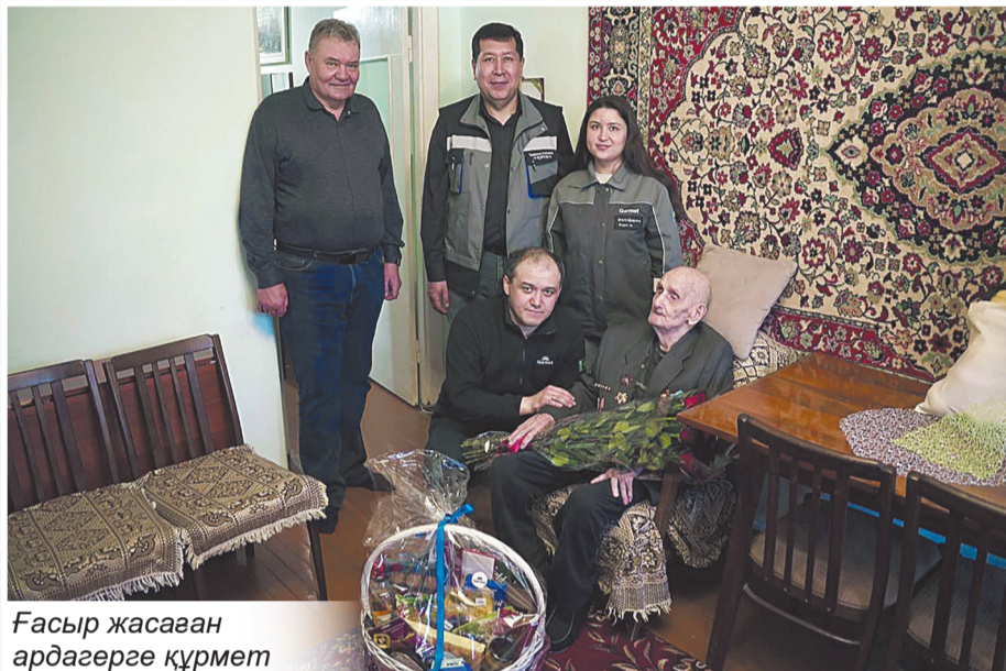
Гасыр жасаған ардагерге құрмет

«Әкем пулеметшілер курсын тәмамдаған. Ірі калибрлі пулемет өзінен биік, салмағы әкесін-