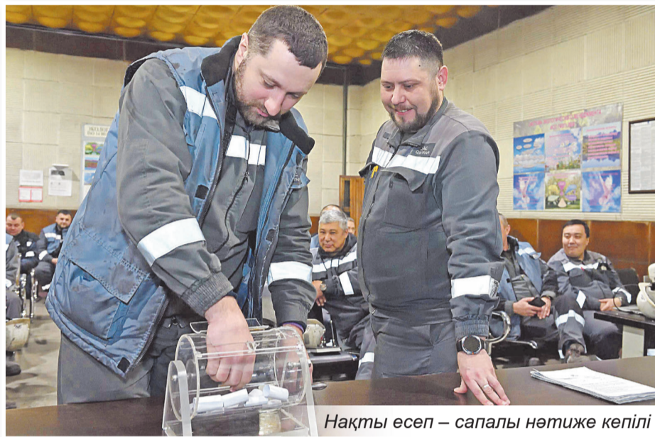
Нақты есеп – сапалы нәтиже кепілі

«Qarmet» компаниясының конвертер цехында Наурыз мерекесіне орай тұрмыстық техника ойнатылған лотерея ұйымдастырылды. Іс-шараға 11 қызмет қатысты, ал жұмысшылар тек сыйлық алып қана қоймай, әріптестерін мерекемен құттықтады.