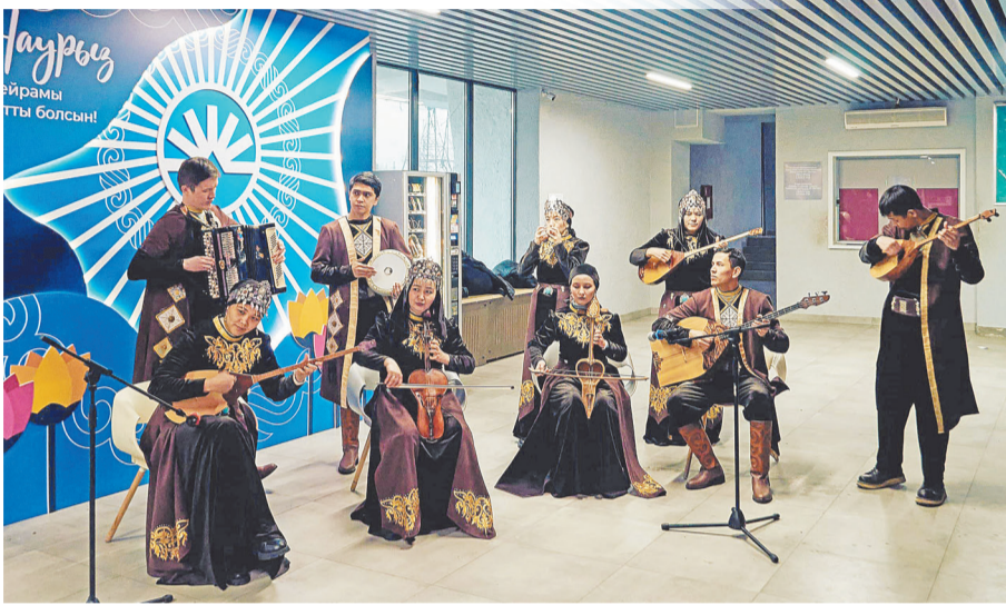
Комбинатта Наурыз: дәстүр мен өндіріс үндестігі

Мерекелік іс-шаралар бірлік, дәстүрге құрмет және корпоративтік рух атмосферасында өтті. Кәсіпорын жұмысшылары үшін киіз үйлер тігілген арнайы мерекелік алаң жасақталып, қонақтар ұлттық тағамдармен және жылы шырайлы қонақжайлықпен қатысты. Қызметкерлер мен олардың отбасылары көктемгі жаңару мен халықтық дәстүрлердің ерекше атмосферасын сезіне алды.