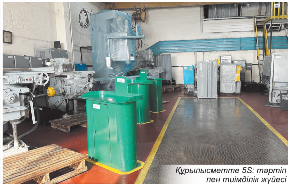
Құрылысметте 5S: тәртіп пен тиімділік жүйесі

Жүйенің тиімділігі нақты нәтижелермен дәлелденуде. Құралдар мен материалдарды ұтымды орналастыру операцияларға дайындалу және іздеу уақытын қысқар-