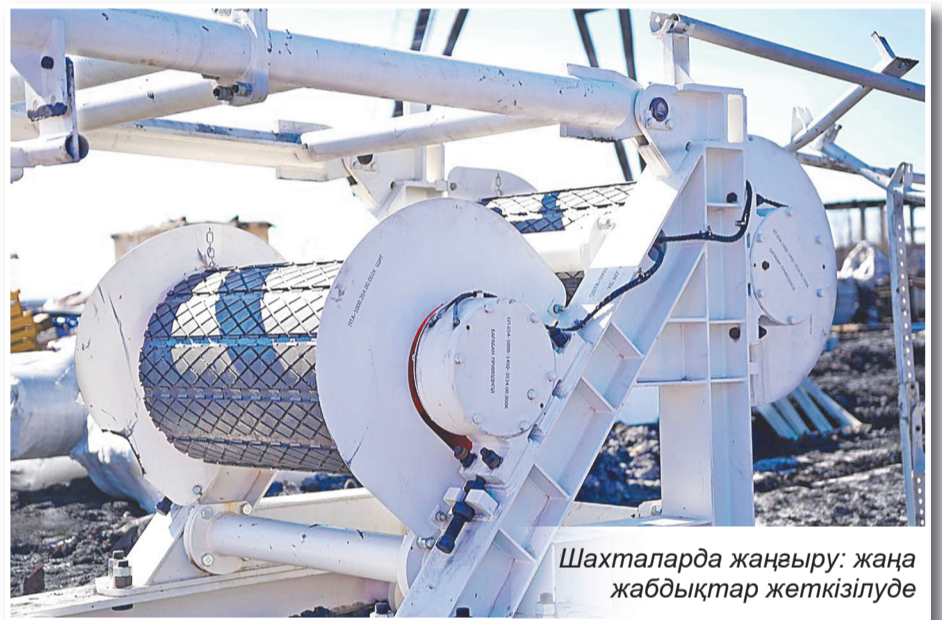
Шахталарда жаңғыру: жаңа жабдықтар жеткізілуде

Қазіргі уақытта «Саран» және «Шахтинск» шахталарында жабдықтарды бақылау жинақтау және сынақтан өткізу жұмыстары жүргізілуде. Жалпы, компанияның Көмір департаментіне осындай тоғыз конвейер жеткізіледі.