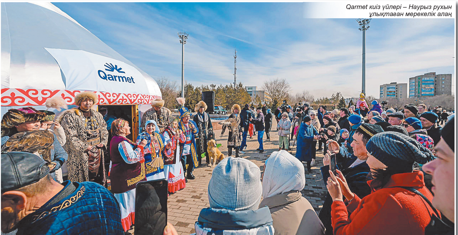
Qarmet киіз үйлері – Наурыз рухын ұлықтаған мерекелік алаң