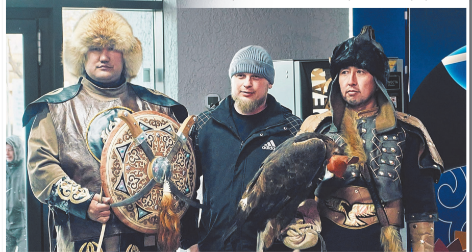
Праздничную атмосферу дополнили фотозоны с батырами и беркутом

Работников угощали традиционными блюдами, баурсаками и горячим чаем, создавая ощущение домашнего уюта даже в производственной среде. Праздничную атмосферу дополнили выступления ансамблей и яркие творческие номера, наполненные национальным колоритом.