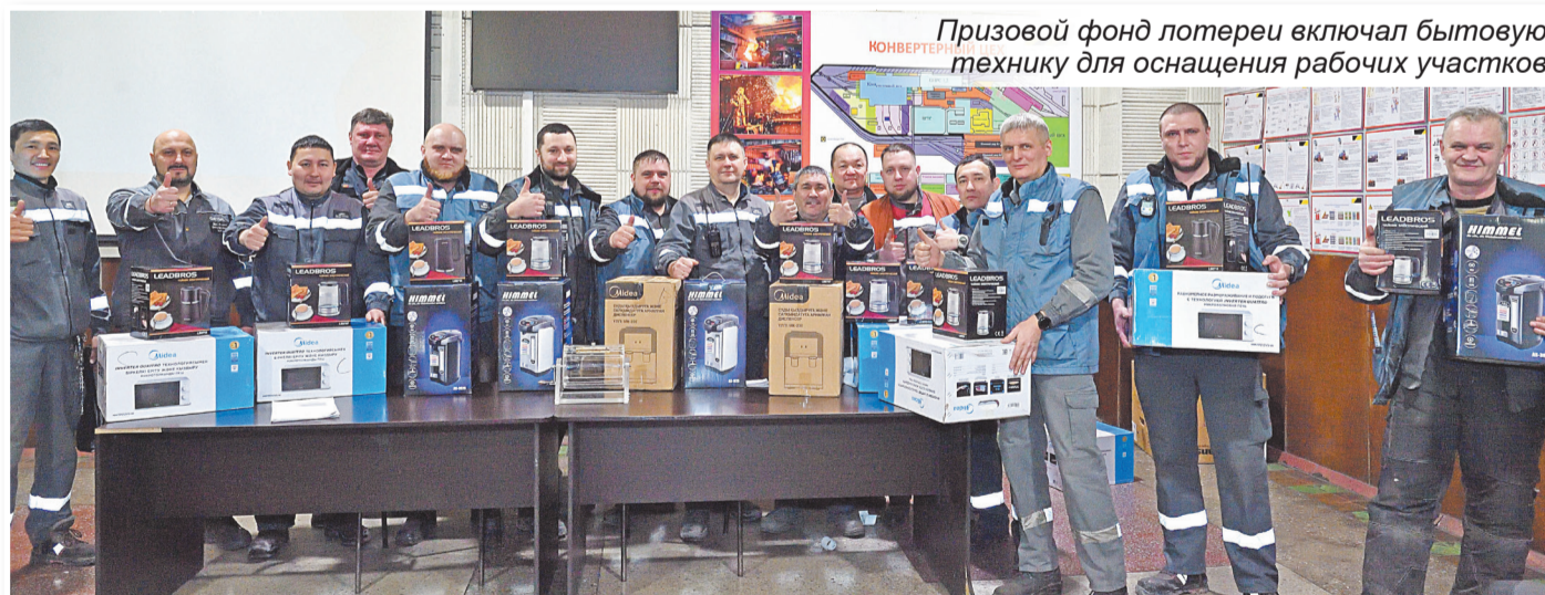
Призовой фонд лотереи включал бытовую технику для оснащения рабочих участков

вые печи, холодильник, электрочайники, водонагреватели и диспенсеры. Таким образом, сотрудники получили не только приятные, но и полезные подарки для повседневной работы.