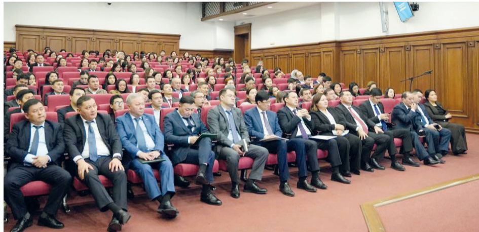
Қазақстан Республикасы Экология және табиғи ресурстар Министрлігі, www.gov.kz материалдар бойынша

Іс-шара барысында қатысушыларға конституциялық реформаның негізгі новеллалары, оның философиясы мен стратегиялық бағдарлары түсіндірілді. Адам құқықтары мен бостандықтарының басымдығын бекітуге, құқықтық мемлекет қағидаттарын нығайтуға, билік тармақтарын нақты ажыратуға, сондай-ақ мемлекеттің зайырлы сипатын нығайтуға бағытталған нормаларға ерекше назар аударылды.