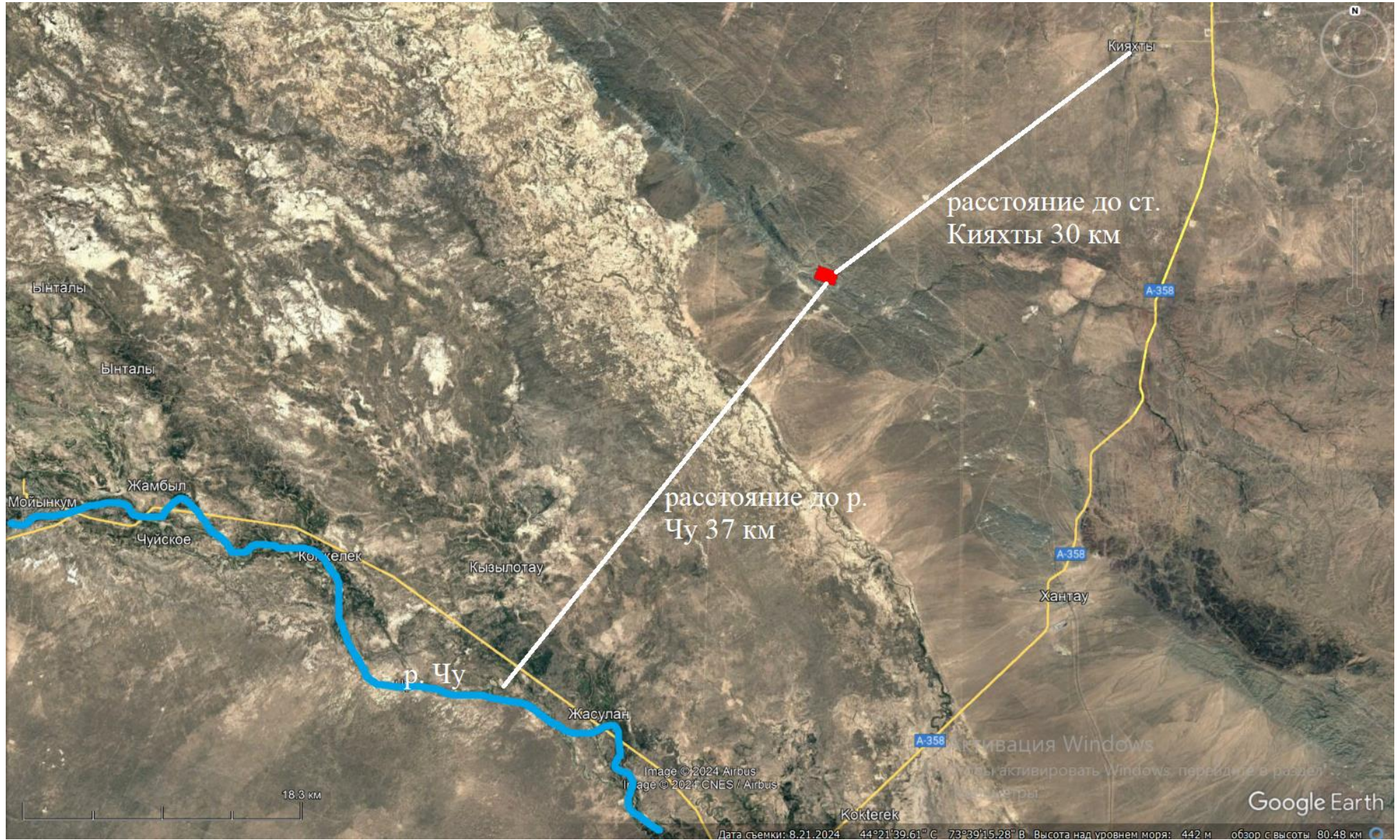
Рис. 2 - Ситуационная карта-схема месторасположения месторождения Ушалык