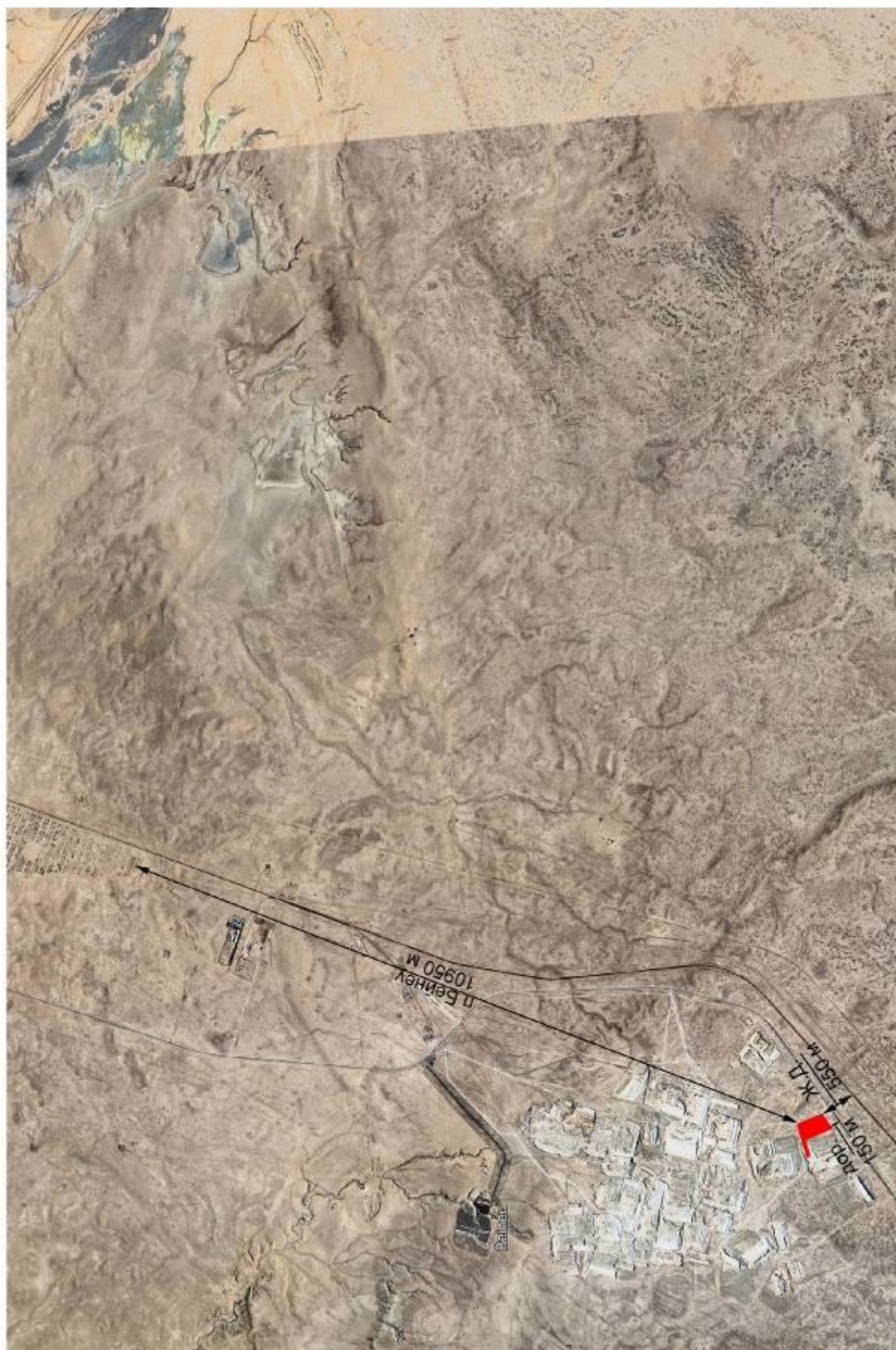
Контрактная территория ТОО «Бейнеу Пласт» на части Бейнеуского месторождения