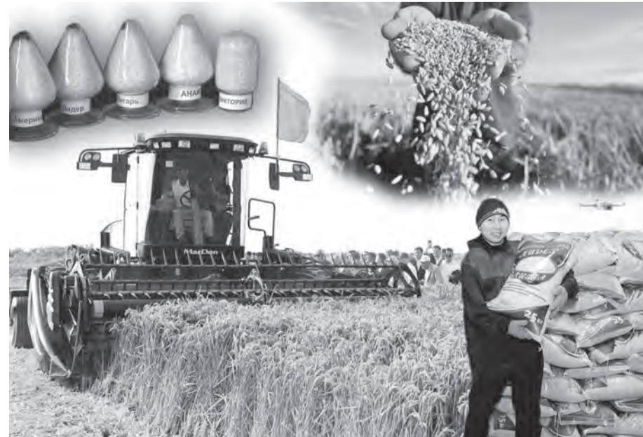
Ашық дереккөздер негізінде дайындаған Б.Салмурза.