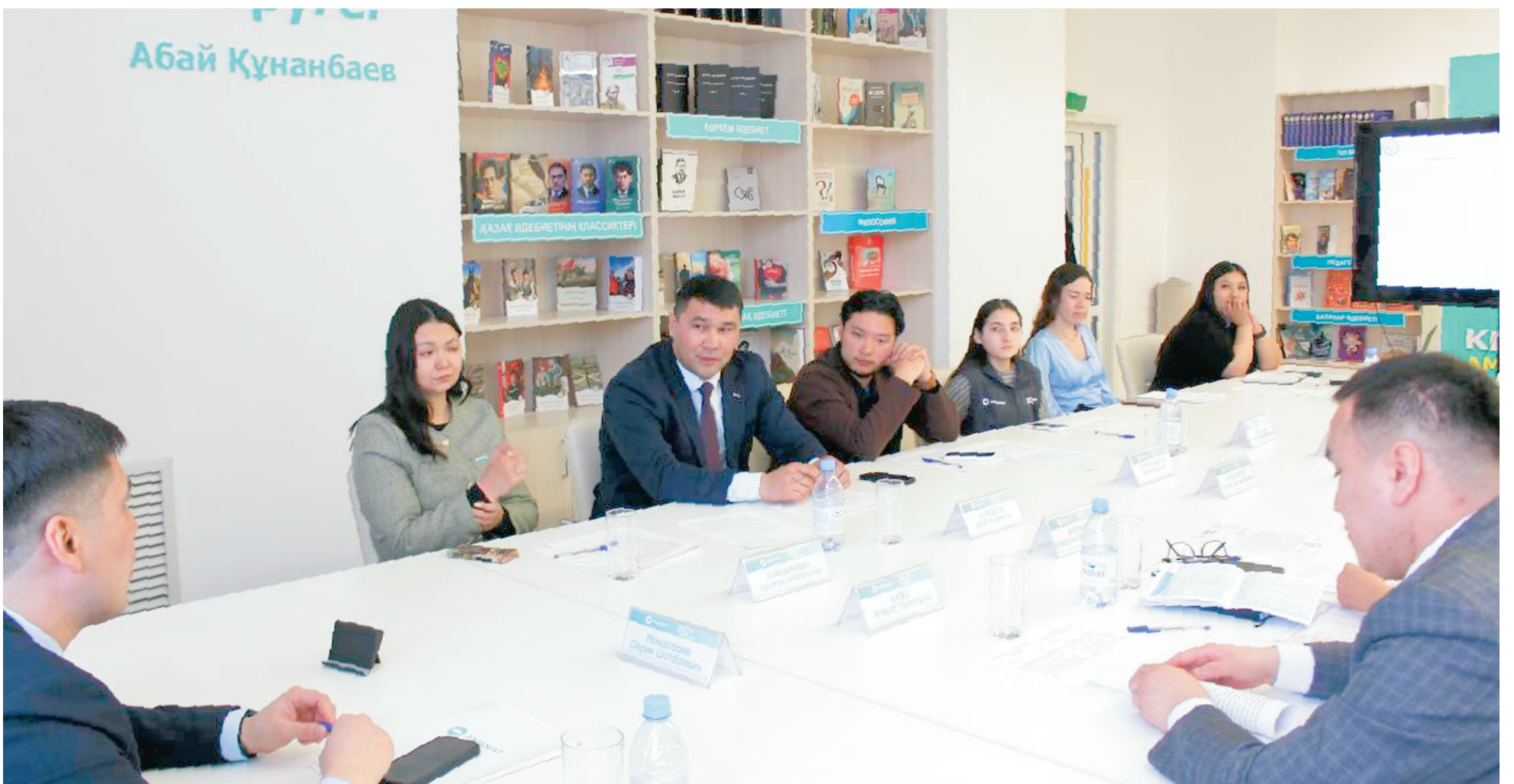
Только за прошлый год из 25 предложений членов совета было исполнено 19, что уже хорошо...

► Шанс заработать есть, но шанс учиться используют не все