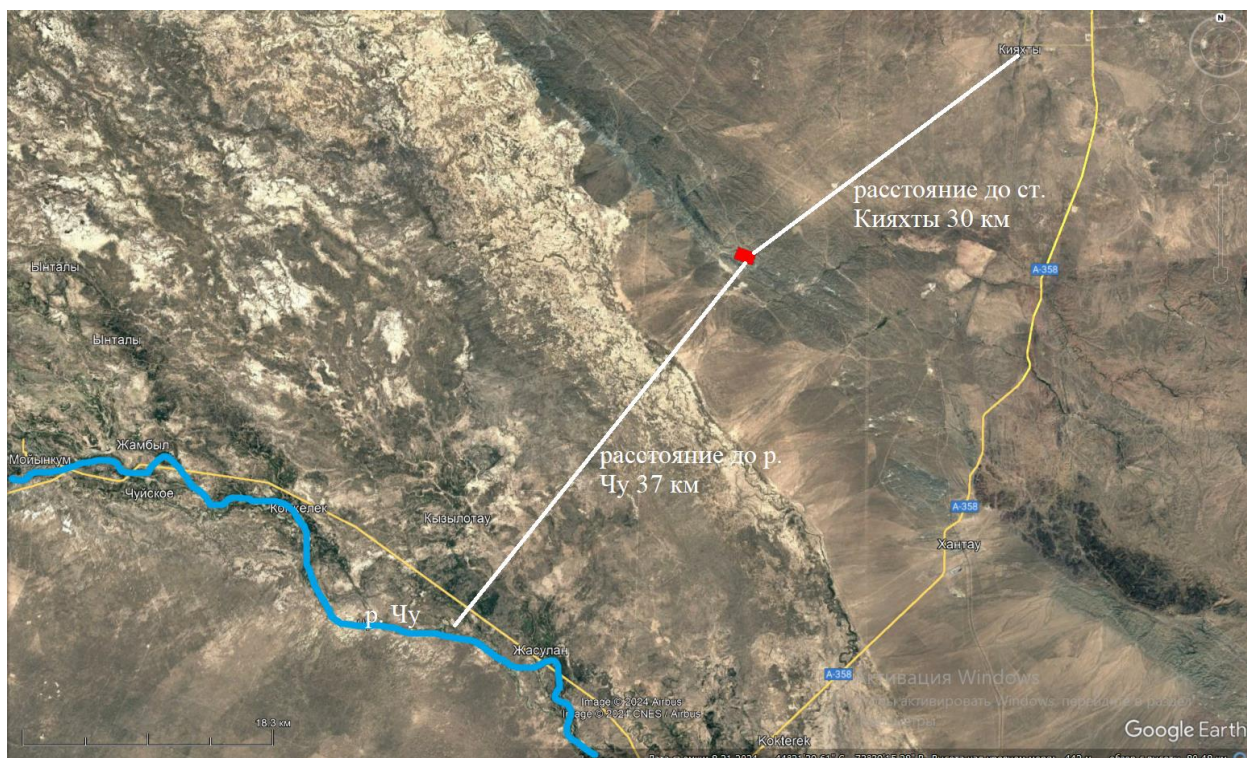
Рис. 2. Ситуационная карта расположения месторождения

Климат района. Климат района резко континентальный с длительной суровой зимой и жарким летом. Средняя температура холодного январского месяца -35^{\circ}\text{C} , а жаркого июльского +40^{\circ}\text{C} . Глубина промерзания почвы 1,0-1,5м. Среднегодовое количество осадков не превышает 275мм. Ветры часты и меняют направления от восточного до северо-западного.