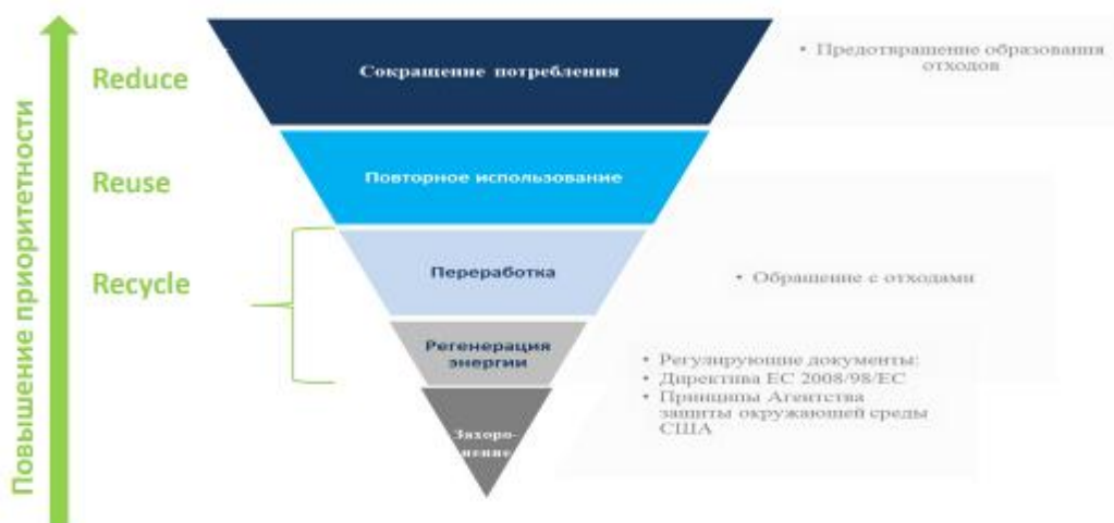
Рисунок 2.1 Иерархия с обращениями отходами.