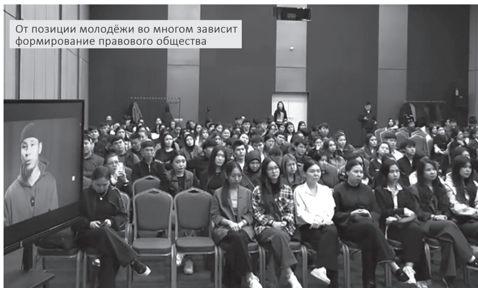
От позиции молодёжи во многом зависит формирование правового общества

Лудомания, наркотики и киберпреступления – об этих рисках, с которыми всё чаще сталкивается молодёжь, говорили студенты вместе с полицейскими в Атырау. Поводом для диалога стала научно-практическая конференция «Закон и порядок глазами молодёжи».