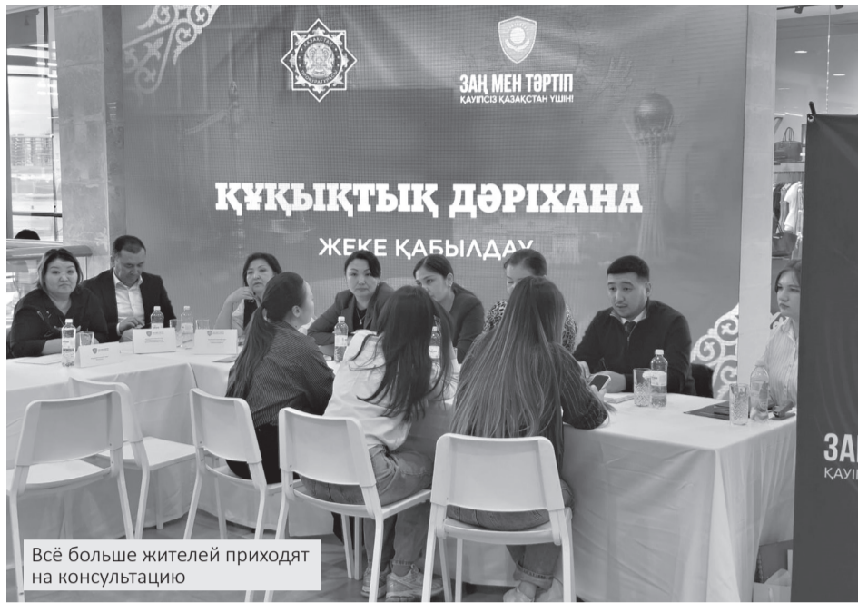
Всё больше жителей приходят на консультацию

В Атырау прошла акция «Правовая аптека», во время которой жители могли бесплатно получить юридическую помощь. В течение дня за консультациями в одном из торговых центров города обратились более ста человек. Люди приходили с разными вопросами – от жилья и земли до трудовых споров и социальных выплат. Специалисты разъясняли, как действовать в каждой ситуации и куда обращаться в дальнейшем.