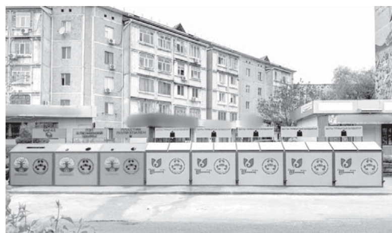
Бетті дайындаған: Әлия ҚҰРАЛБЕК.

Аталған бастама Мемлекет басшысының тапсырмасына сәйкес «Таза Қазақстан» акциясы аясында жүзеге асырылып, тұрғындардың экологиялық мәдениетін арттыруға және қаланың санитарлық жағдайын жақсартуға бағытталған.