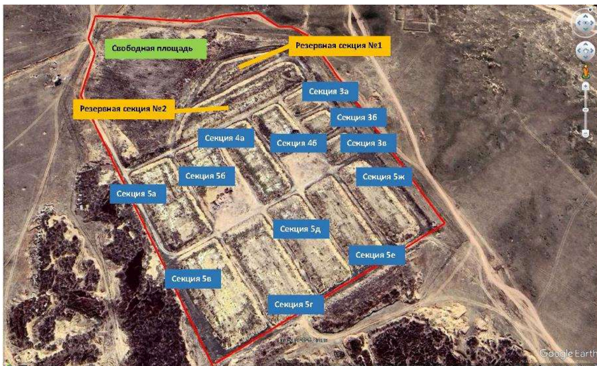
Рисунок 1.1.1-1 Карта – схема полигона

Проектируемые автомобильные весы с навесом и операторной расположены на территории промышленной площадки АО «СЭГРЭС-2».