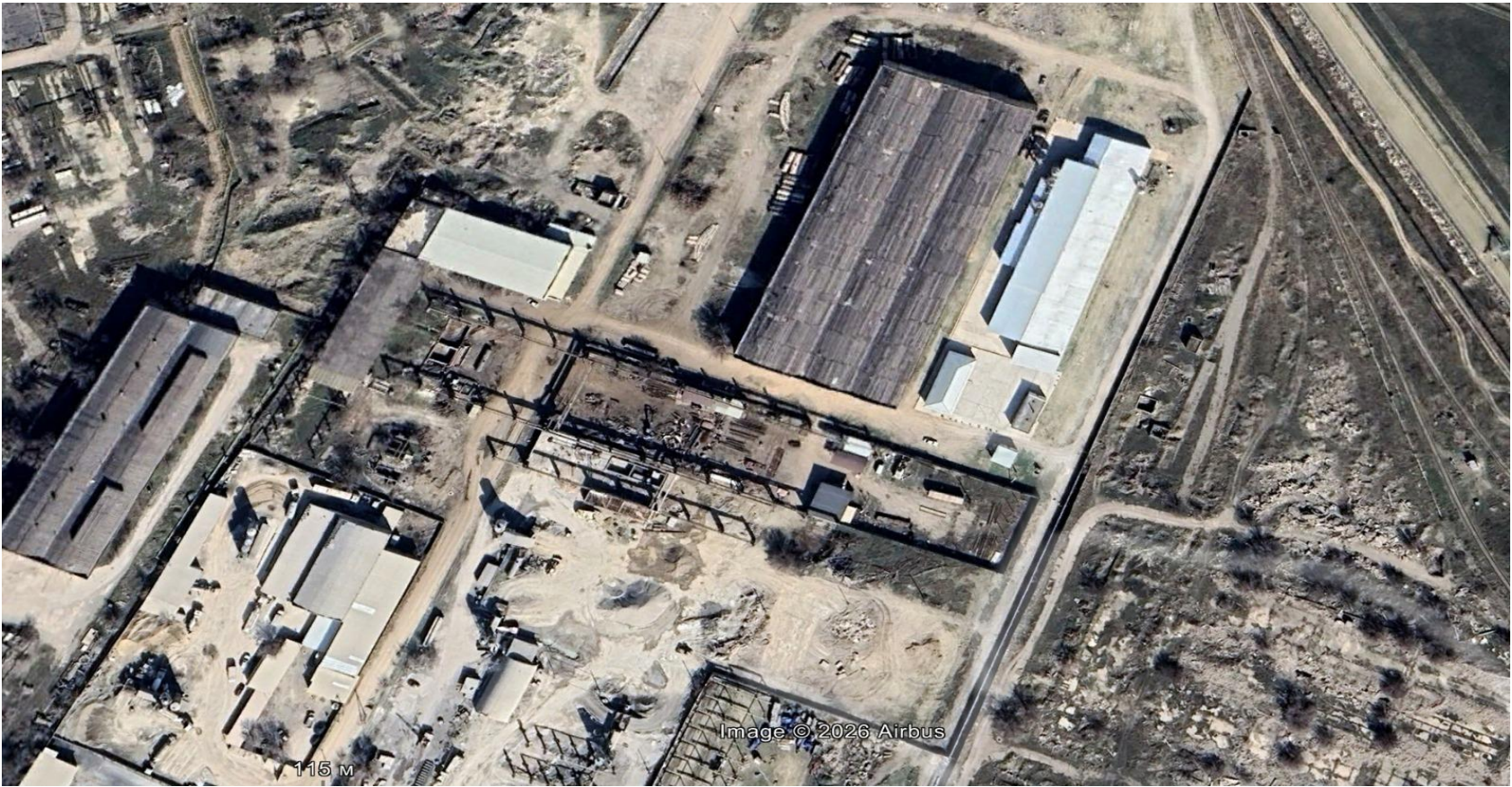
Рисунок 1.1 – Ситуационная карта-схема района расположения объекта