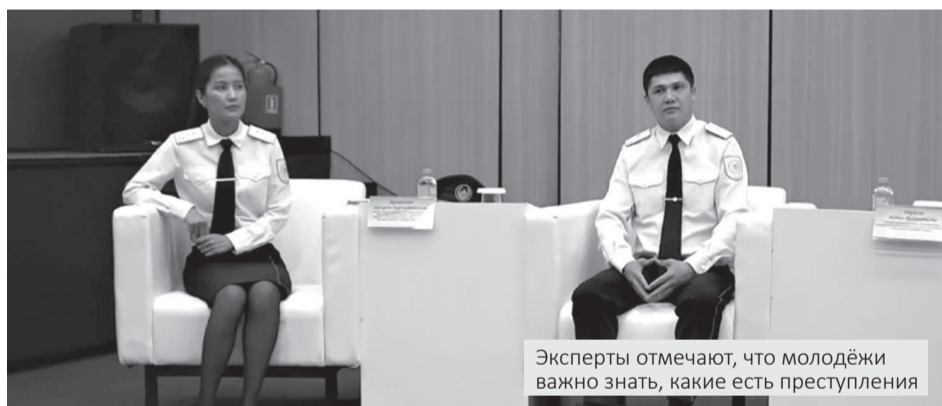
Эксперты отмечают, что молодёжи важно знать, какие есть преступления

Лудомания, наркотики и киберпреступления – об этих рисках, с которыми всё чаще сталкивается молодёжь, говорили студенты вместе с полицейскими в Атырау. Поводом для диалога стала научно-практическая конференция «Закон и порядок глазами молодёжи».