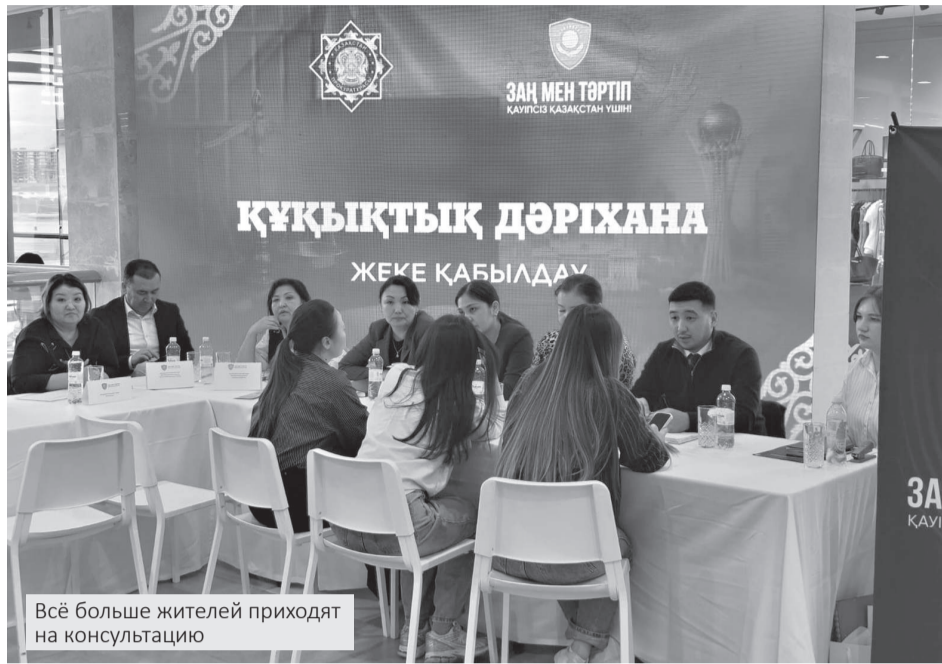
Всё больше жителей приходят на консультацию

В Атырау прошла акция «Правовая аптека», во время которой жители могли бесплатно получить юридическую помощь. В течение дня за консультациями в одном из торговых центров города обратились более ста человек. Люди приходили с разными вопросами – от жилья и земли до трудовых споров и социальных выплат. Специалисты разъясняли, как действовать в каждой ситуации и куда обращаться в дальнейшем.