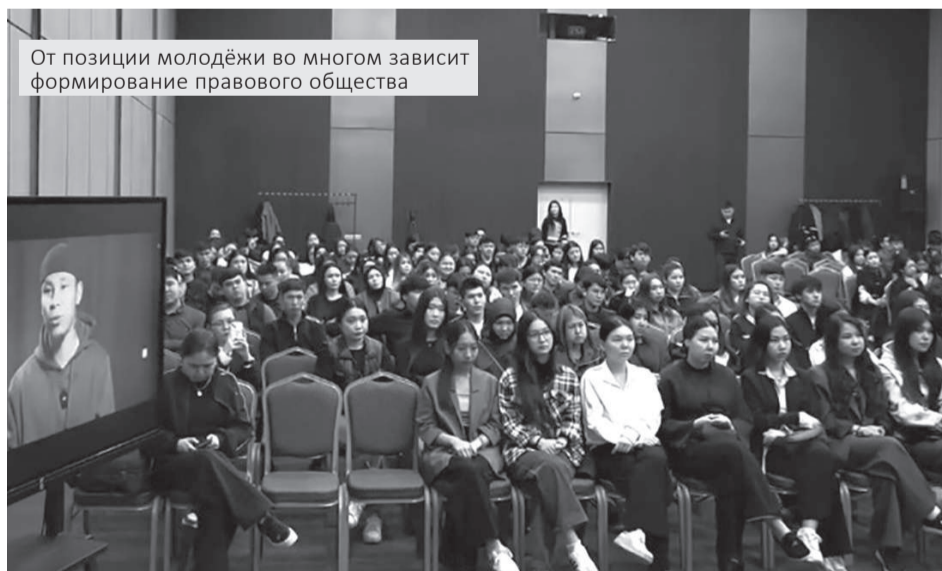
От позиции молодёжи во многом зависит формирование правового общества

Лудомания, наркотики и киберпреступления – об этих рисках, с которыми всё чаще сталкивается молодёжь, говорили студенты вместе с полицейскими в Атырау. Поводом для диалога стала научно-практическая конференция «Закон и порядок глазами молодёжи».