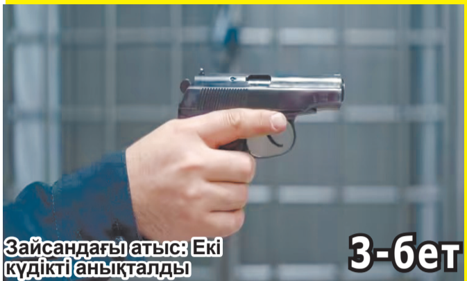
Зайсандағы атыс: Екі күдікті анықталды