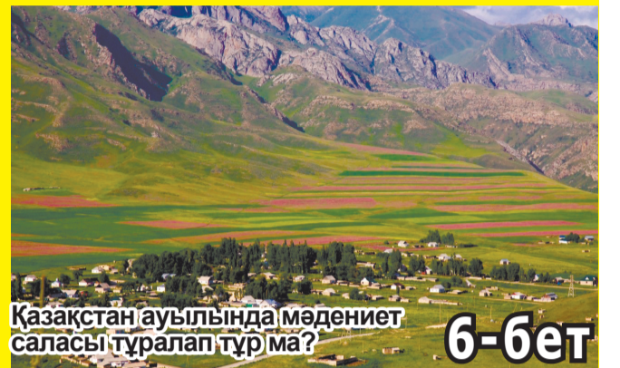
Қазақстан ауылында мәдениет саласы тұралап тұрма?