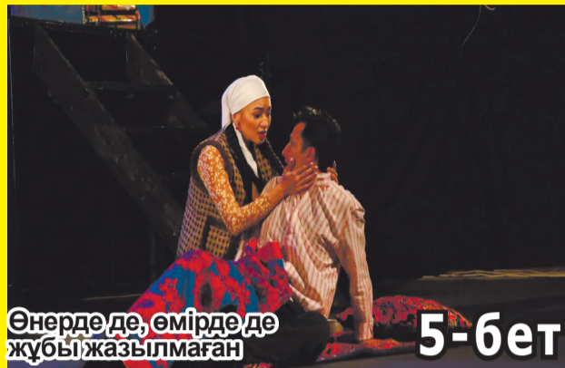
Өнерде де, өмірде де жұбы жазылмаған