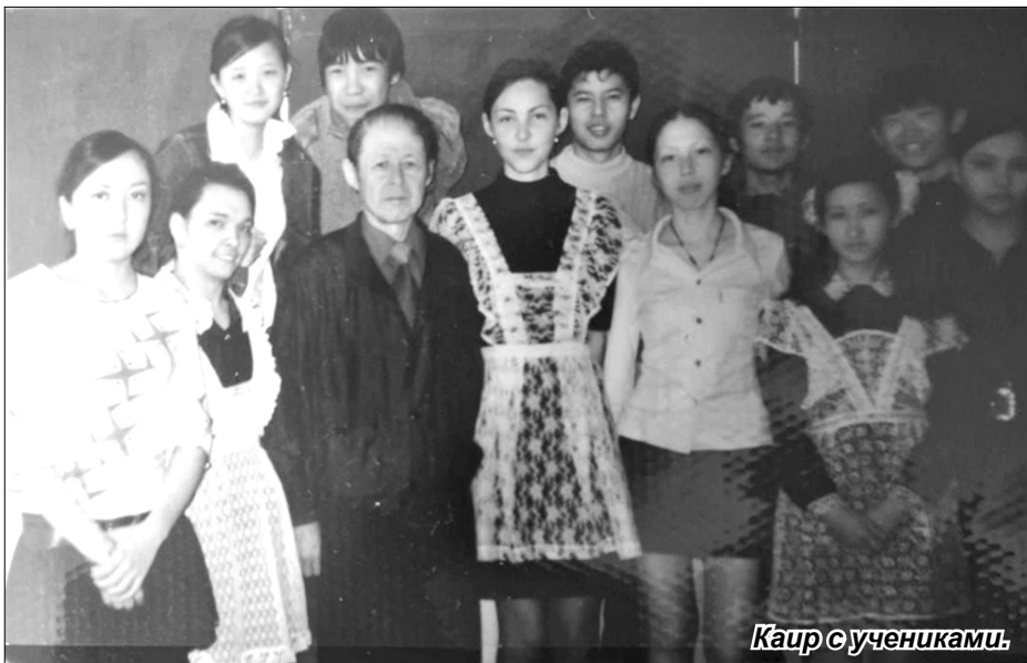
Каир с учениками.