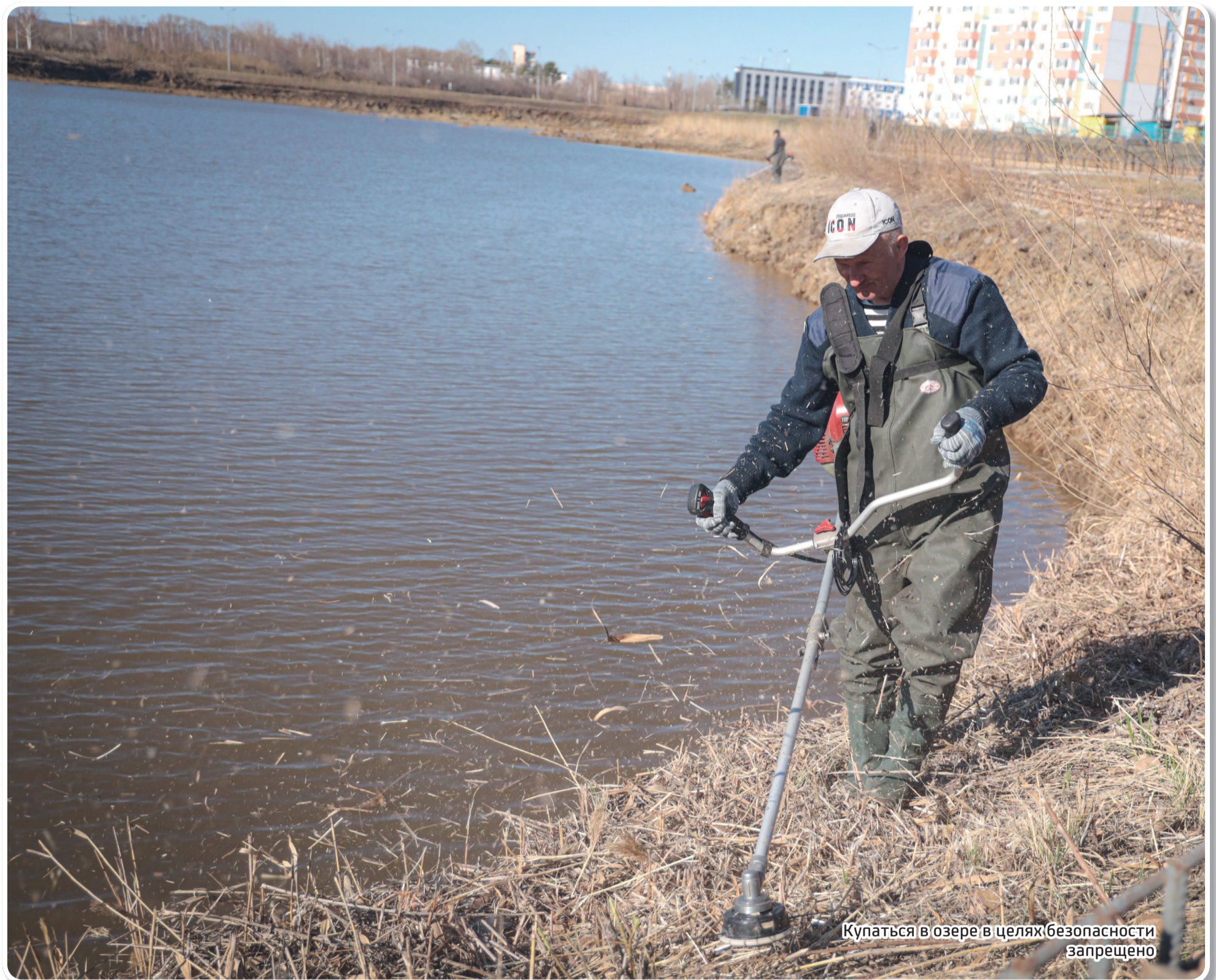
Купаться в озере в целях безопасности запрещено

Озеро «Тарелочка» в мкрн «Аэропорт» наполняют талыми водами