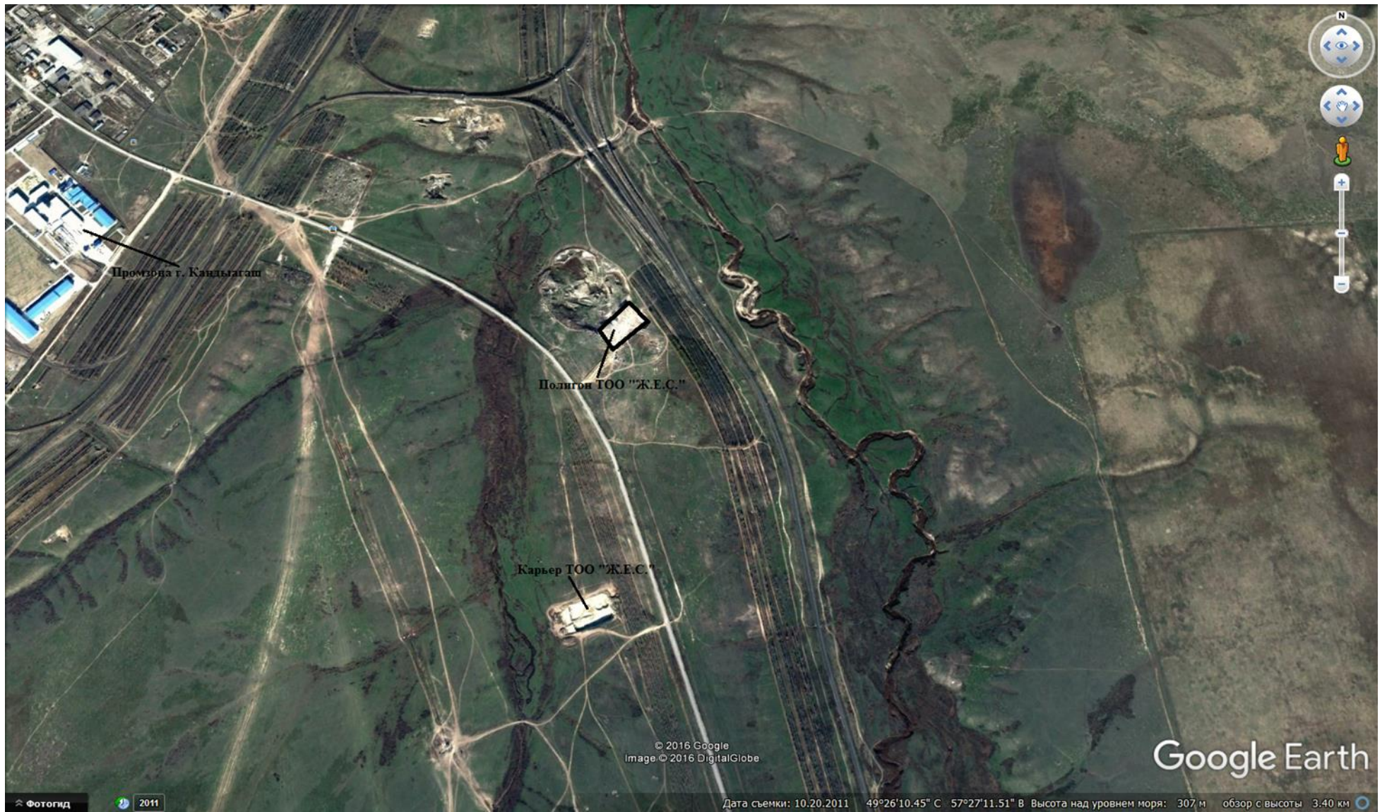
Рисунок 1-1 Схема расположение земельного участка