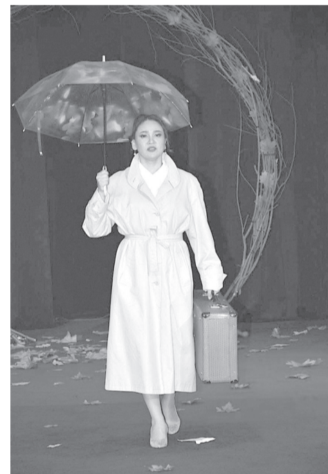
«Қызыл алманы» оқыңыз!... «Қызыл алманы» көріңіз!..